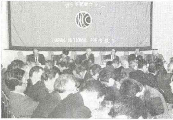
「五輪に参加しない国は、それ自体で“敗北”です」 サマランチ I O C 会長昼食会 (11.24)

クラブが毎年、この季節になると取り組む仕事の一つは、「日本記者クラブ賞」の候補者推薦である。会報前号で推薦要領をお知らせしたところ、さっそく何人かの会員から心