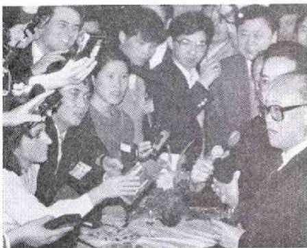
記者団に囲まれる趙紫陽総書記(11.2)

外国人シャットアウトの要人居住区、中南海も参観させてくれた。サービスと素直にとって良いのかもしれない。もっとも、毎日会見を聞いたからといって、必要な情報が簡単に得られるというものでもない。そこは西側社会と同じだ。中国側の「会見攻勢」とでもいうものに対応するため、記者の側にも新たな取材体制を整える必要が生じている。今後の課題だろう。中国の底流の変化をみるために、なお努力が必要なのは変わらないのである。