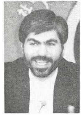
C・ウィリアム・ベリティ米商務長官

い、「安保理決議を、イエスとはいわなかったが、今回初めて拒絶しなかった」。侵略者の発表と停戦を同時に実現させるのが第一ステップであり、他の部分については議論するのは時間のムダという立場である。