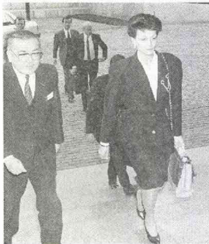
「おしなれ」も話題になったパレストラン警視正 (11.10)

万円強奪事件には国内の人間がからんでいないのか」――など、数多くの問題が残っている。 この事件は、大きく様変わりしている現代版事件の典型といえる。現場は国境に関係なく広がる。一方、日本人、外人が複雑にからみ、さらに連鎖的に他の事件と結びつくケースだった。 それだけに、取材の範囲は従来の経験を越え、苦心の連続、いや毎日が勉強のような取材活動に思えた。 (十一月二十六日記) まつしま 上おる 一九七二年読売新聞入社 横濱支局を経て 社会部 本年五月から警視庁クラブ