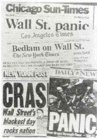
「CRASH」「PANIC」が躍る米各紙写真 WWP

ウォール街では何が起きても不思議ではない。例えば思いもよらない企業の大規模合併・買収などは日常茶飯事。再度の株暴落もあり得る。事実、エコノミストの中には悲観的な見通しも根強い。