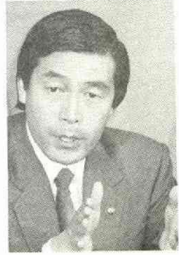
富野暉一郎 逗子市長

当選後初の市議会開催の前日、池子問題の本質について話したい、という市長の申し出を受けての会見となった。