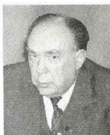
アレクサンドル・N・ヤコブレフ (ソ連共産党政治局員兼書記)