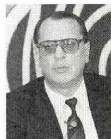
イーゴリ・ゴレンビオフスキー