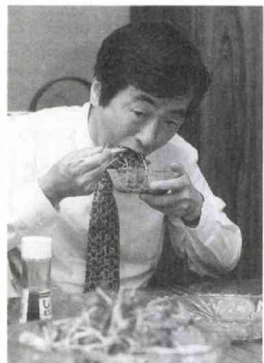
かいわれを食べ安全性をアピールする菅厚相(8.15)

行政が中途半端な格好であっても公表したことは、逆に行政という権威を得て記事化に際して安心感があったのではないかと、と自問自答している日々で