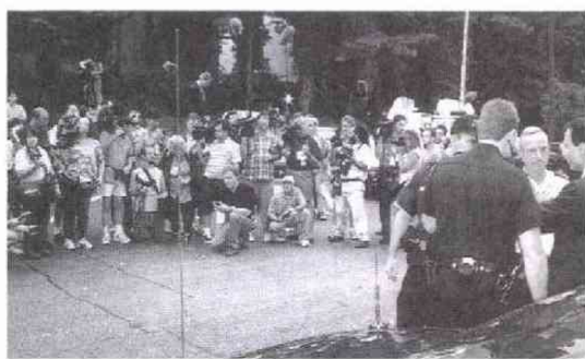
「焦点の男性、宅前に詰めかけた各国取材陣—共同

かねむら ひろむ氏 一九七三年共同通信入社 高知支局 大阪社会部などを経て 九四年から社会部次長