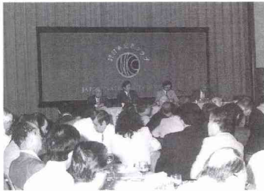
9月旗揚げを表明した鳩山由紀夫氏昼食会 (8.2)

異常渇水のせいでしょうか、八月末の涼しさのせいでしょうか、東京ではいつもより早く、秋色が濃くなっています。