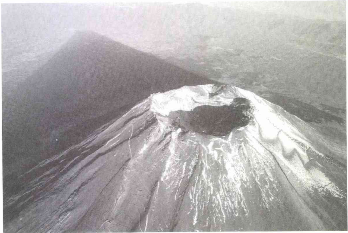
御殿場市上空約4000メートルで