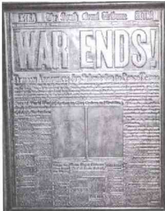
一八一紙にもおよぶ米紙の歴史的な一面の原板コピーがロビーの壁に埋め込まれている。これはインディアナ州の「サウス・ベンド・トリビューン」紙の号外

いずれも大盛況。でも、何か変なのです。テーブル席でメモを取っている人がほとんどいないのです。話に相いづちを打ち、大きな拍手を送っていた大半の出席者は、テーブル席を丸ごと買い占めたゲスト・スピーカーや関連諸団体、PR会社の招待客だったので、現役記者のほとんどは、食事なしで一階上の十四階バルコニーに陣取って取材をしていました。食事などをしていては、仕事にならない、ということでしょうか。チケットの代金も、会員二千五百円、非会員三千四百円と差をつけ、ほとんどを一般売りして収益を上げています。