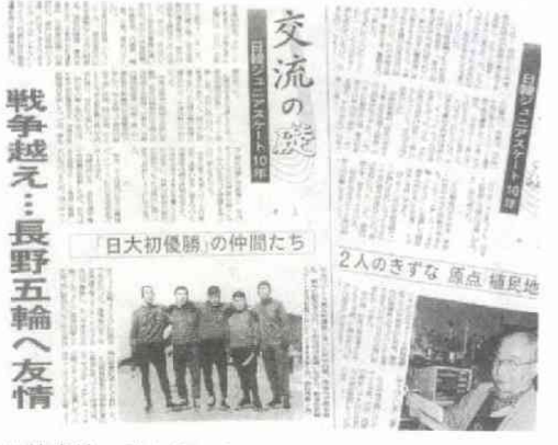
日韓交流の礎を築いたスケート人の軌跡をたどる

五輪の報道合戦はいよいよ本番。戦力豊富な全国紙は脅威であり、厳しさを覚悟している。当初の理念論議が実るような、背骨が通った記事で地元五輪を伝えたい。 （まるやま・こういち）