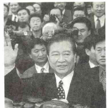
当選の翌日、国会に立ち寄った 金大中氏(97.12.19)