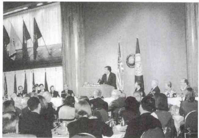
ビル・リチャードソン米国連大使の昼食会（12月9日）：食事後、冒頭発言から質疑応答まで、立ちっぱなしの会見

その一、会員に朝食の無料サービス。その二、各施設は朝七時から夜十一時までオープン。