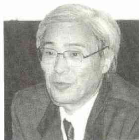
6.10 (水) 研究会「原子力技 術の現状と将来」委員 出席 56人

高速増殖炉「もんじゅ」の事故以来、原子力には暗い話が多く、報道の目も厳しくなっているが、地球環境問題で二酸化炭素の排出が課題となり、頼るエネルギーといえは原子力しかないと認識されだした昨今。日本記者クラブで原子力の研究会が持たれた。