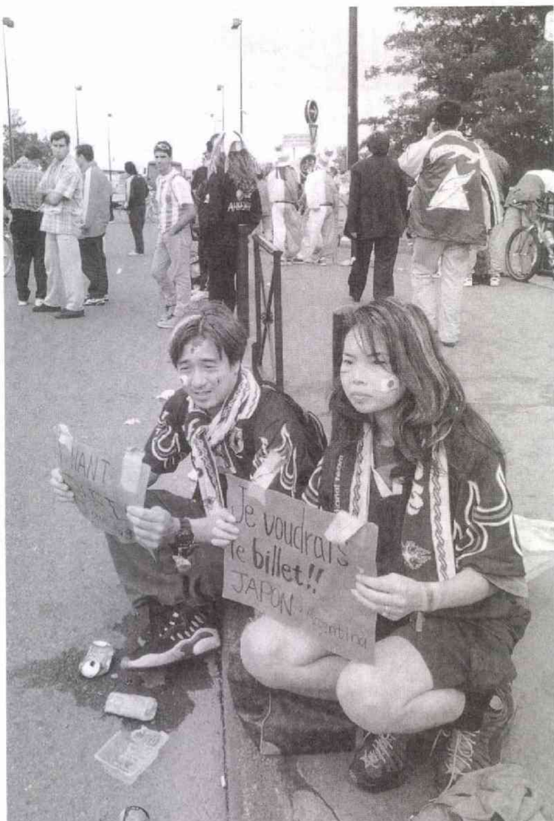
アルゼンチン戦の当日、スタジアムの外で 必死にチケットを求めるサポーター (6・14)

(一九八五年サンケイスポーツ新聞入社 プロ) 野球 F-1などプロスポーツを担当