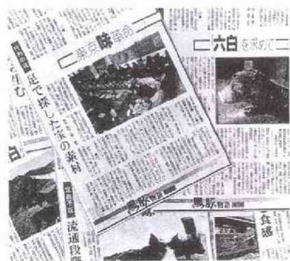
長期連載で人氣の秘密から歴史までを

では、人氣を支えるうまさの秘密と生産者たちの純粋種の黒豚にかける心意気を描いた。取材中の第三部「復活の軌跡」(仮称)は、歴史と盛衰、高度成長期に絶滅の危機からよみがえった経緯を探る。来年まで合計八部を予定し、奄美鳥豚やもう一つのルーツといわれる英国バークシャー種を求めた旅、鹿児島黒豚に続けると全国各地で始まった銘柄豚づくりの挑戦などをリポートするつもりだ。物語は始まったばかり。鹿児島黒豚の全体像を説明することで、読者と一緒に日本人の食文化や農業の未来まで考えることができたい。ばと思っている。