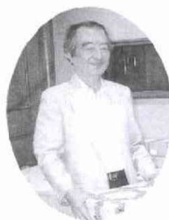
会長賞はワイン半ダース

第二に、一局終わったら、必ず初 手から並べ直すこと。相手が上位者 だったら、要点の解説を聞くこと。