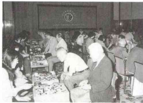
夏の恒例行事となったアツイ戦い

紅友会との親善対抗試合も今回で五回目。過去最高の二十五人の女性軍を迎え、にぎやかな一日を過ごしました。