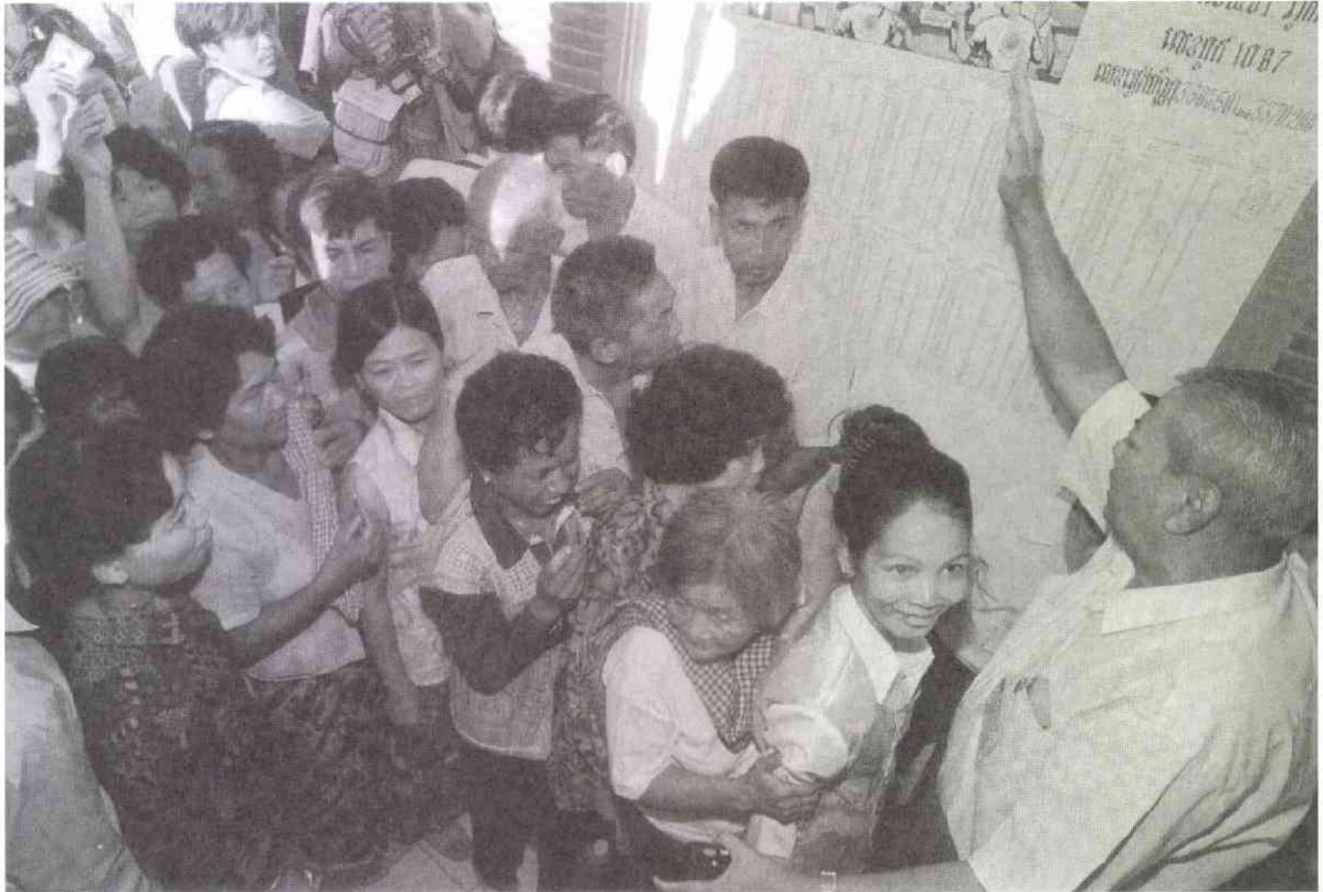
早朝から総選挙の投票所に有権者が つめかけた (7.26 カンダール州)