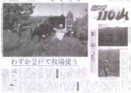
毎週土曜日、カラー面の企画が目々ひく