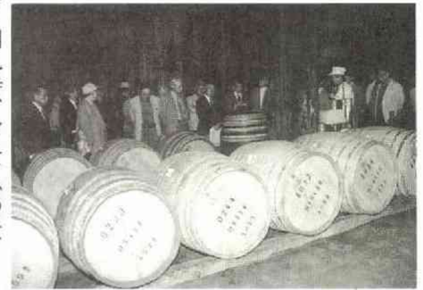
常温18度の樽専用の貯蔵庫。一樽でポトル五百本分がとれる。

七月二十二日朝九時、富士急の大聖バスは四十人余りの参加者に乗せ、雨もよいのプレスセンター前を出発した。数日前ラウンジでは「俺起きれるかな」なんておっしやっていた先輩諸氏のお早いお着き、お早い居眠り。