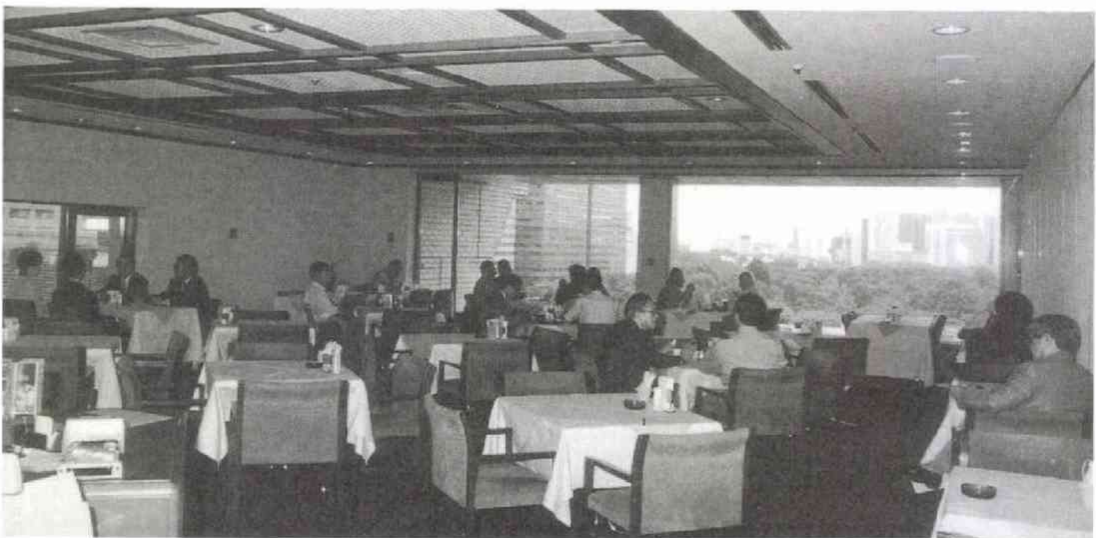
▲和食専門となった9階のレストラン。昼は刺身、天ぷら定食のほか日替わりで肉料理や焼き魚、井ものを提供します。ピラフ、カレー、スパゲッティもOK。夜は懐石料理のほか、つまみセットの酒菜御膳や日替わり御膳、一品料理も用意。地酒も楽しめます。