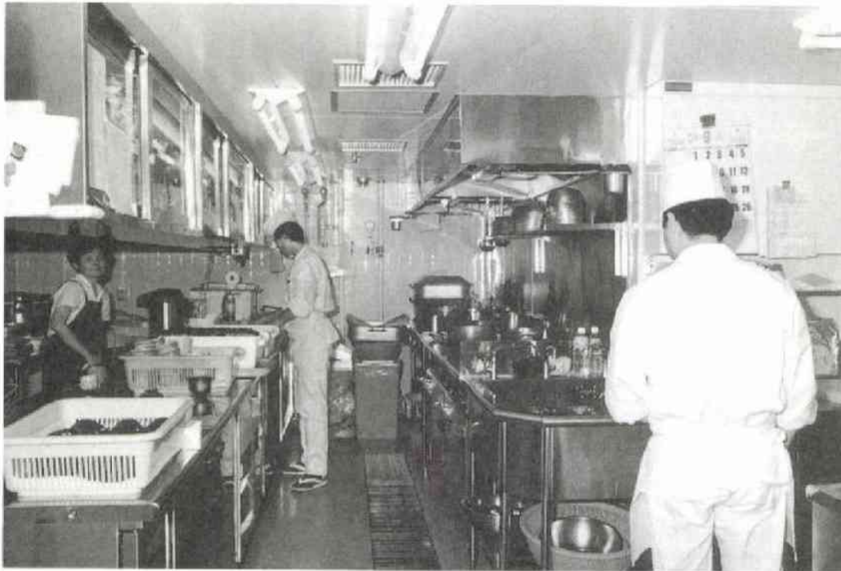
◀これまでの1.4倍、広さ64平方メートルに拡充した和食厨房。天ぷら専用器や完全自動炊飯器などの“新兵器”もそろいました。会議室での弁当やパーティーでの寿司もここでつくられます。薬科板長と3人の板さんが、会員の皆さんのため腕をふるいます。