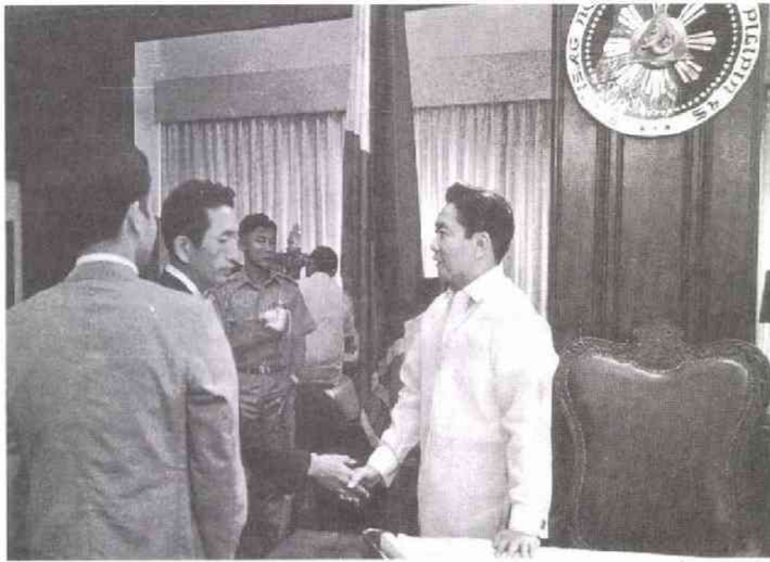
マラカニアン宮殿でマルコス大統領（右）と握手する筆者（1970年）

されそうなタラップを駆け上り、機内にすべり込んだ。座席につき安全ベルトを締めながら、今度は私がつぶやく番だった。