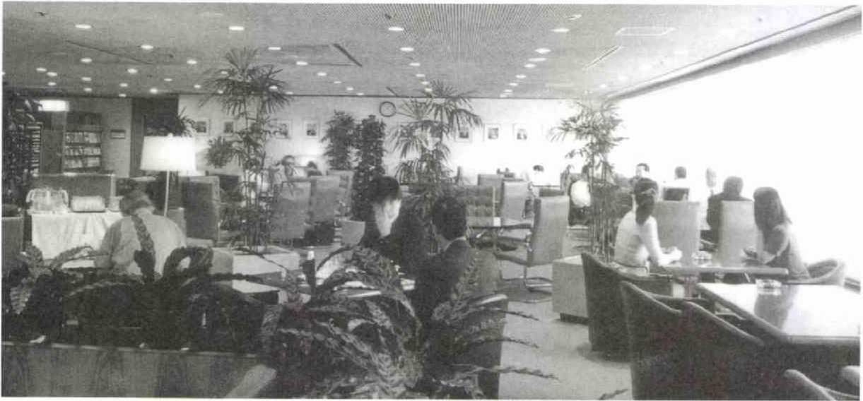
▲会見で使っていたVIP用の椅子を、プレスセンターから拝借して模様替えしたラウンジ