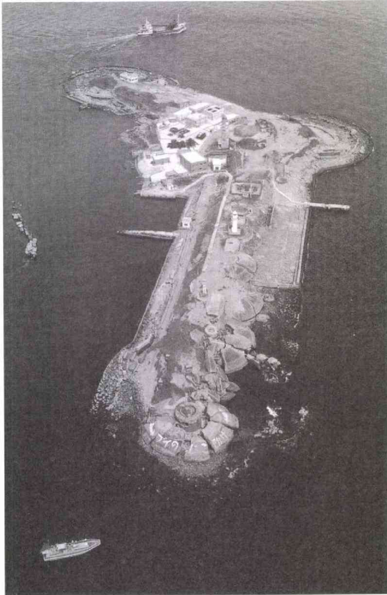
砲台跡が並ぶ東京湾「第二海堡」(8・7)