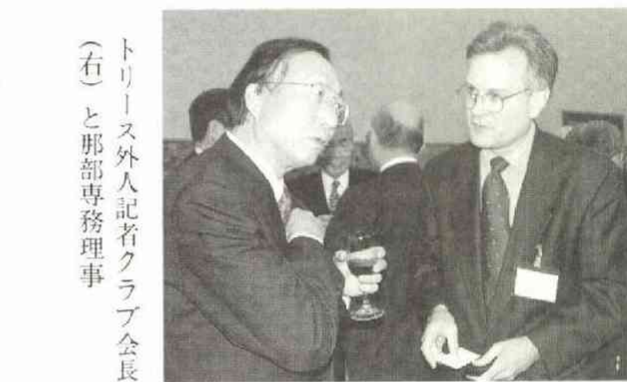
トリース外人記者クラブ会長(右)と那部専務理事

北日本新聞社 北國新聞社 京都新聞社 神戸新聞社 奈良新聞社 山陽新聞社 中国新聞社 四国新聞社 愛媛新聞社 高知新聞社 西日本新聞社 佐賀新聞社 熊本日日新聞社 大分合同新聞社 宮崎日日新聞社 沖縄タイムス社 琉球新報社 Q.U.I.C.K. 日本新聞協会 日本プレスセンター 日本放送協会 東京放送 日本テレビ放送網 日本短波放送 全国朝日放送 フジテレビジョン テレビ東京 エフエム東京 エフエムジャパン WOW OW 毎日放送 読売テレビ放送 札幌テレビ放送 宮城テレビ放送 テレ ビ埼玉 新潟放送 東海テレビ放送