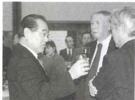
堀川企画委員長(左)と話が弾む