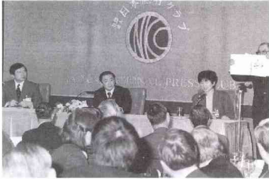
「和」と揮ごうした橋本行革担当相の胸の内は…(1.17)