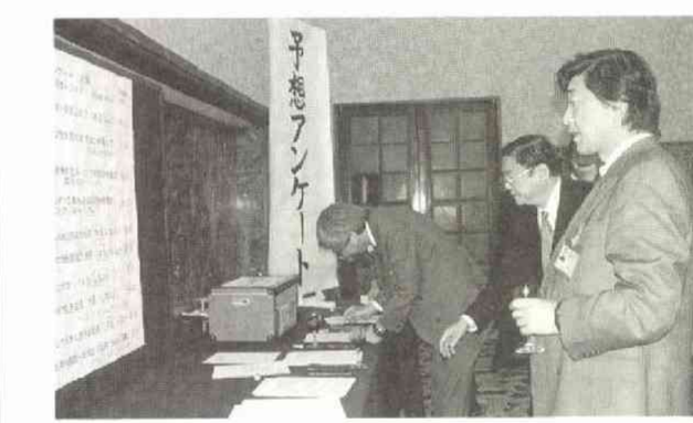
「今年もむずかしいなあ」—結果は1年後のお楽しみ

東海ラジオ放送 中国放送 広島ホーム テレビ 新広島 四国放送 RKB毎日放送 福岡放送 テレビ西日本 衛星チャンネル 日本民間放送連盟 アラスカ 協同広告 シヤンドウィック・インターナショナル 大 中外製薬 帝国ホテル テュボン 電 通 電通パブリックリレーションズ 東京 ガス 東京機械製作所 東京電力 トヨタ 自動車 日本ABC協会 日本航空文化事 業センター 日本新聞インキ 日本中央 競馬会 日本電気協会 JR東海 JR東 日本 博報堂 三菱商事 メリルリン チ日本証券(会員名簿順)