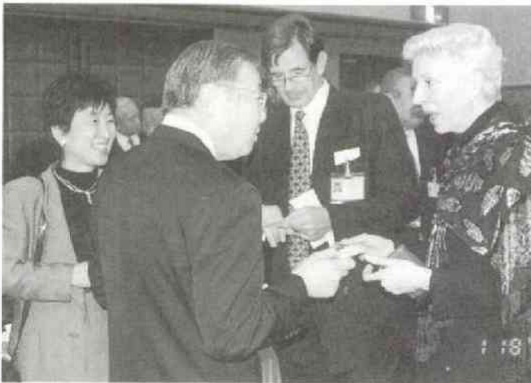
EJ駐日代表部のライター広報部長(中央)とドミニク報道室長(右)