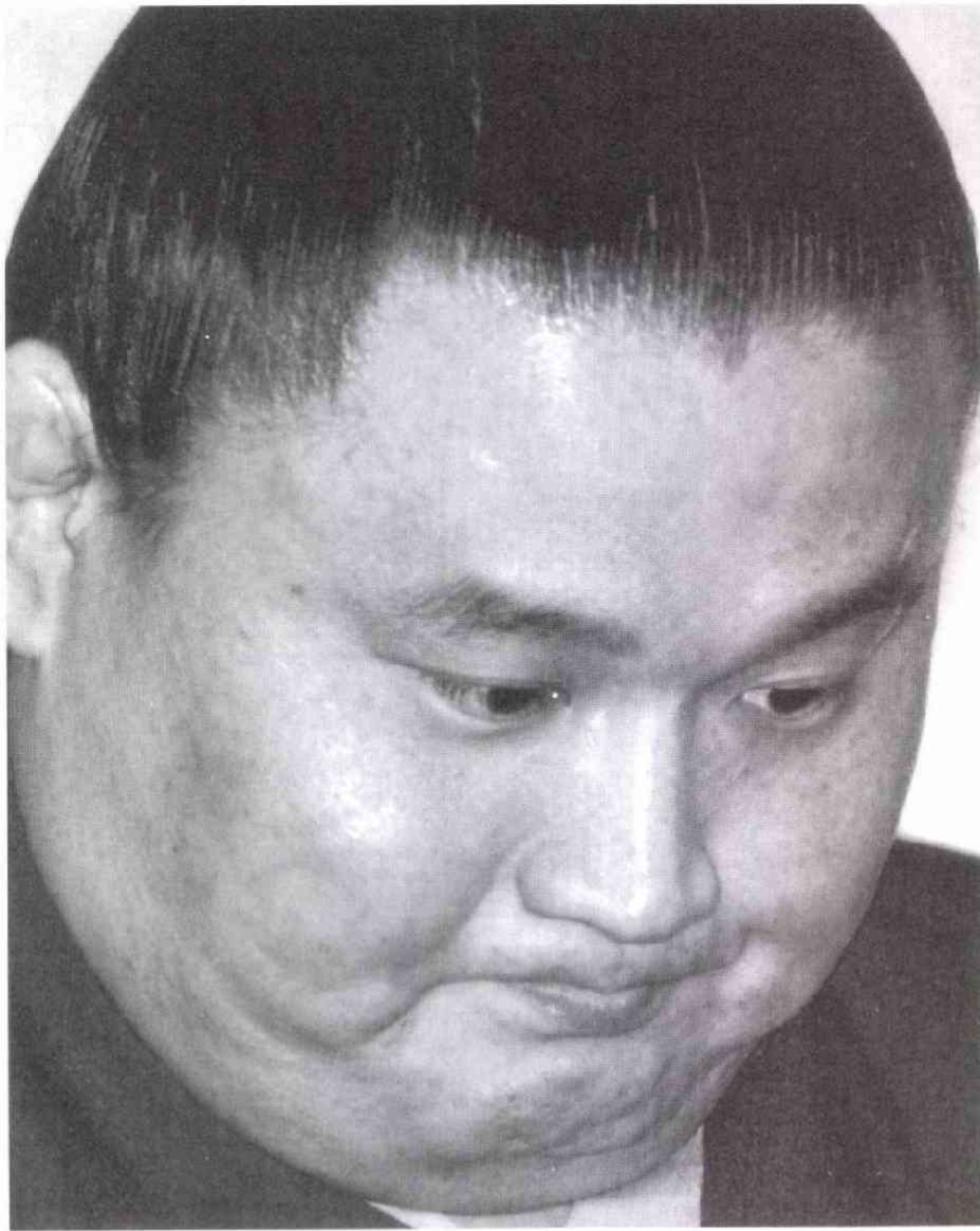
横綱引退の記者会見 (1・20 両国国技館)