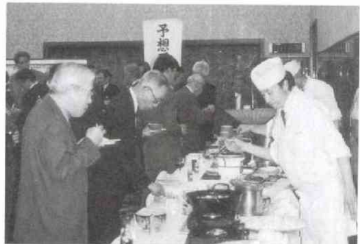
平均年齢のせいもあってか和食コーナーが人気でした