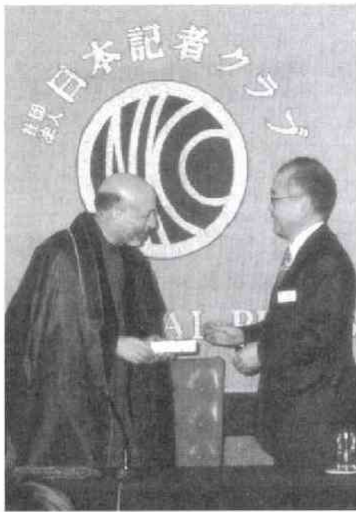
北村副理事長からポールベンを贈られ、大統領は「アリガトゴザイマス」と日本語で(2・21)