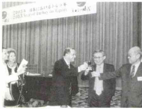
終了後行われたレセプションで会員と杯を合わせる副首相(中央) 左から二人は駐日大使

ことしは「日本におけるトルコ年」です。オープニング会見が、ヤルチンバユル副首相とウナイドウン駐日大使が出席して行われました(2月17、大使館主催)。