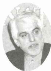
委員 朗子 井由 人 5.16 (金) 中森 61 司 会 通 出 席

「残酷なフセイン政権の崩壊は喜ばしいことだ」とマジエディ大使は繰り返し語った。「イラク戦争で得をしたのは米国、損をしたのは仏露」とも。「国連無視の先制攻撃は国際秩序を破壊し、アナ