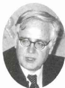
委員 グナ ワ 桂 子 5.19 (月) W 一 石 61 司 会 通 出 席

「すっかり忘れてしまった」といいながらも時折日本語の交じる話し方は柔らかなだが、内容は論理的で明確だった。イラク戦争が必要だったのかについては異論があるとしながらも、いまは過去の違いを蒸し返すときでなく、国際社会全体が戦後再建に取り組むべきだと、ドイツの考え方を説明した。緊急課題の治安と秩序の維持は、占領軍である米英両国の責任だが、戦後再建は全体として国連の傘の下でなければ考えられないという考え方である。