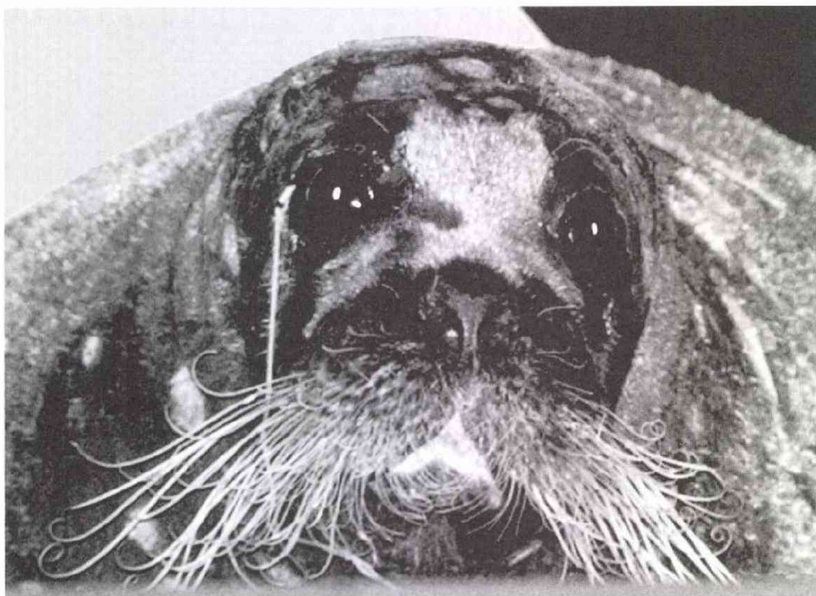
(朝霞市・荒川秋ヶ瀬橋付近 5.4)

(1991年産経新聞入社 大阪本社を経て 96年) から東京本社写真報道局 阪神大震災 ペル ー日本大使公邸人質事件 アフガン戦争など を取材