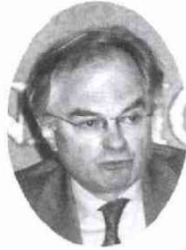
委員 男子 幹事 名宅 人 (水) 春三 64 21 会 通 出 席 5

今年一月に続き、わずか四カ月の間に二度目の登場となった。前々日のドイツ大使とは立場に大きな違いはないのだが、フランス人らしく堂々と論理を展開する話し方は対照的だった。