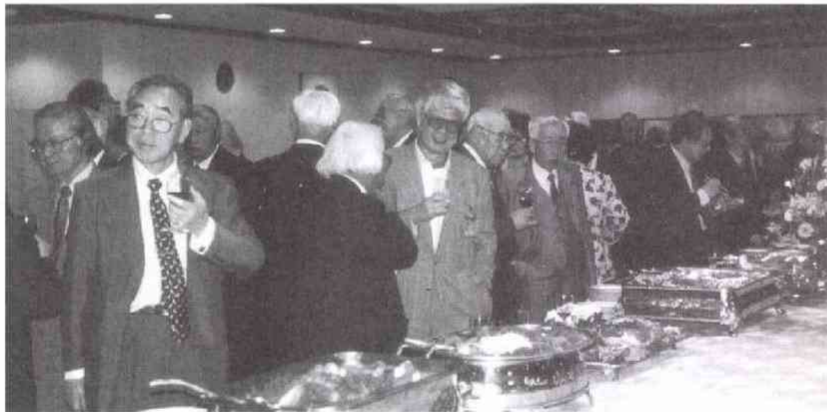
出席者は160人 同僚、先輩、後輩……社の枠を越えて懇談の輪が広がりました