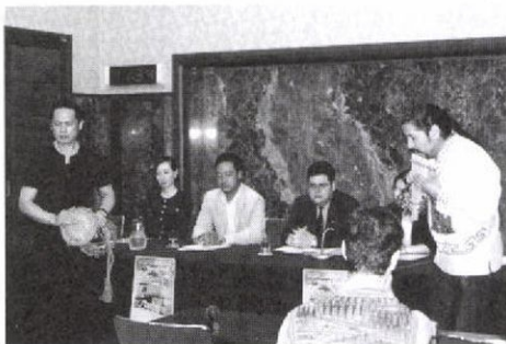
クラブでは基本会員の推薦と専務理事の許可で、会員以外の団体、組織にも記者発表の場として施設を提供している。

○ ペルー独立記念行事 カルデナス副領事が東京の新木場で行う祝祭行事の内容を発表。会場ではペルーの民族楽器と鼓の共演も披露された(7・23)。