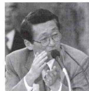
◀第1部司会の影山企画委員