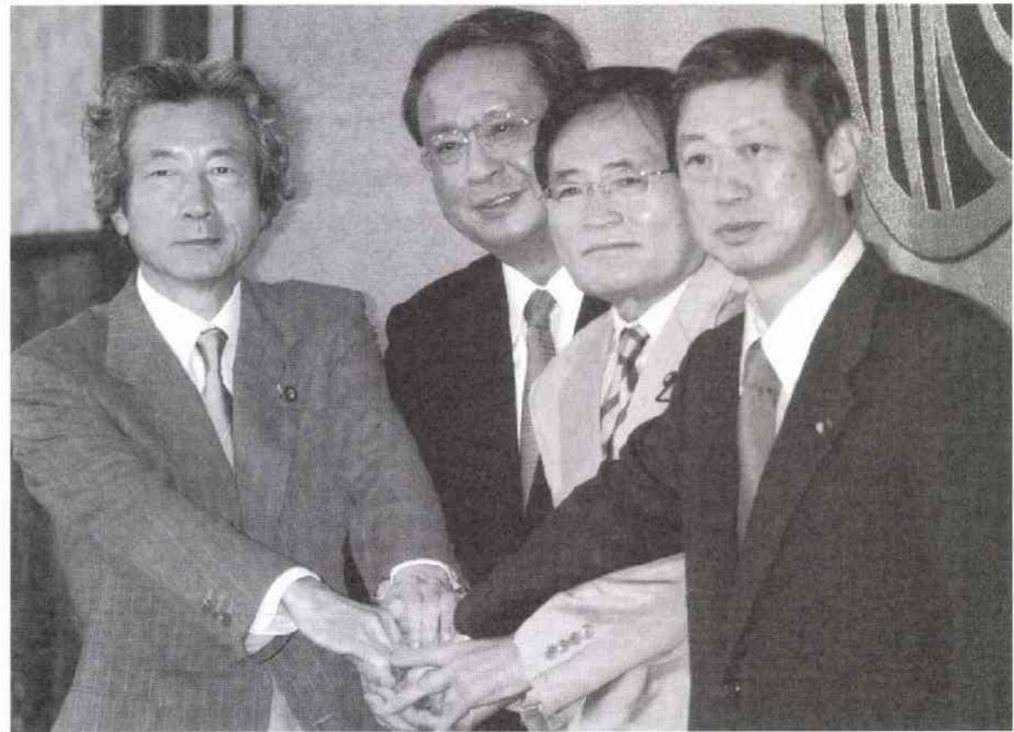
開始直前、カメラマンの「握手してくださいーい」に応じた4候補

本日の討論会にご出席いただきました四人の候補者の方々に深く敬意を表したいと存じます。どうぞ心おきなく、思う存分の論戦を展開していただき、みんなの期待にこたえていただくようお願いいたします。