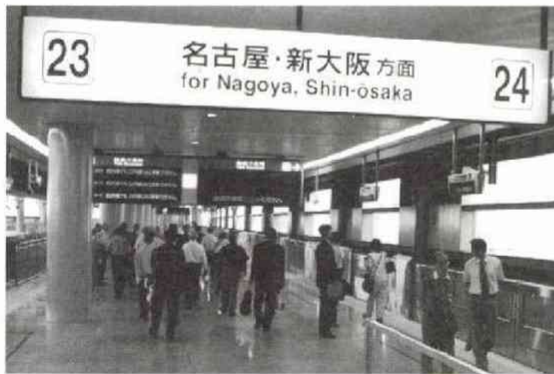
1日6万人の利用が見込まれる新ホーム