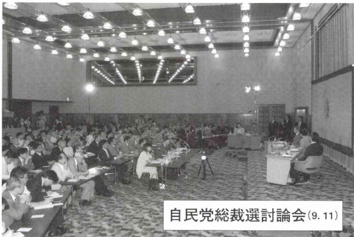
自民党総裁選討論会(9.11)

無 限 即 誠 電 影 裏 光 斬 春 風 2003. 9. 11. 義 實 平成十五年九月十一日 高村正彦 永野健二 飯野奈津子 川戸恵子