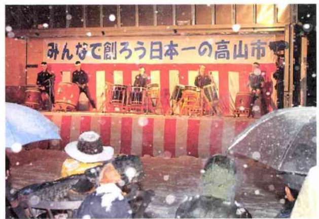
大雪が降るなか、新・高山市誕生を祝う人々＝岐阜県高山市

岐阜はさておき、飛騨高山や春と秋の高山祭といえば、全国的に知名度は高い。高山市は山々に囲まれた飛騨地方の中心地。合併前の市の観光客数は年間約300万人。江戸時代の商家の雰囲気を残す古い町並みに、飛騨の匠（たくみ）が技の粋をつぎ込んだ豪華な祭り屋台が、ギシギシ音を立てて通る風情は、毎年マスコミ各社によって報道されてきた。遅い春に早い冬。桜の開花や初雪など季節の話もこと欠かない。