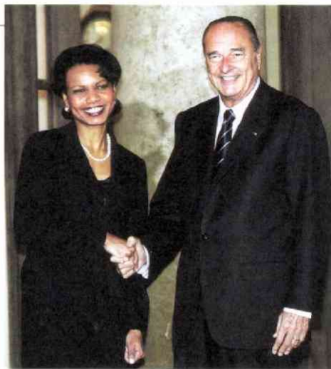
シラク仏大統領との会談を終え「関係修復」をアピール(パリ 2.8)

米大統領補佐官から、アフリカ系女性として初の国務長官へ。第2期ブッシュ政権の「外交の顔」となったコンドリーザ・ライスは長官が最初の外国訪問に選んだのは欧州、中東だった。イラク戦争をめぐって亀裂の走った「米欧同盟」を修復し、任期内に中東和平実現を目指す、という政権の意気込みの表れだ。同行で間近に見た新長官の「外交デビュー」とその素顔を紹介する。