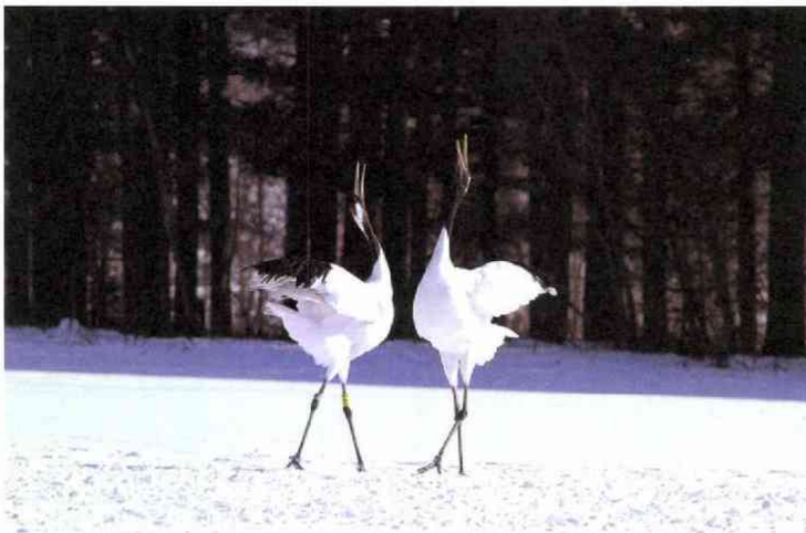
ベーカー大使お気に入りの1枚—離日前に開催した写真展の案内状もこの写真だった(釧路で撮影)

日本、ドイツ、インド、ブラジルの4カ国が入ることについてどう思われるでしょうか。