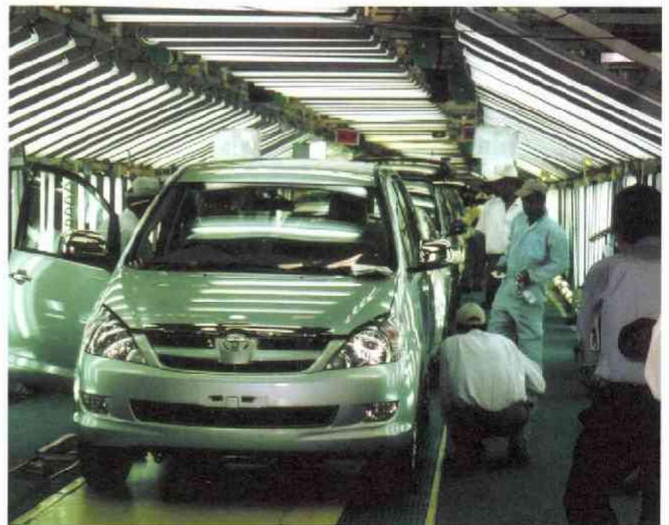
バンガロール南部のトヨタ・キロスカ工場（生産開始 1999年）ワンランク上の乗用車市場にターゲットを