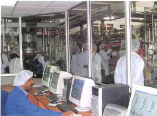
バイオも目玉 会社（バンガロール） バイオコン製薬