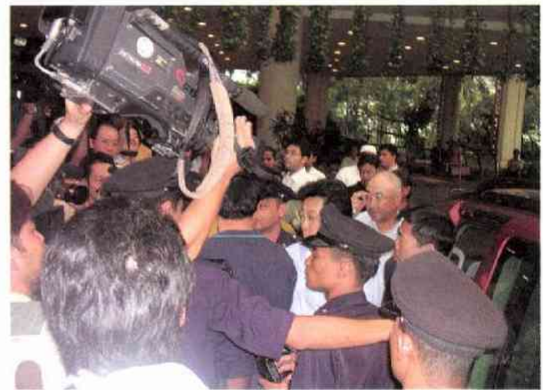
解放された3人は、ペナン島のホテルに到着した3人は、報道陣にもみくちゃに(3.21)

他社の動きに焦りを覚え、東京の外報部長に電話したら「北スマトラで解放される根拠は何？」と冷静に聞き返された。確かに「メダン説」には確たる根拠がなかった。「うわ