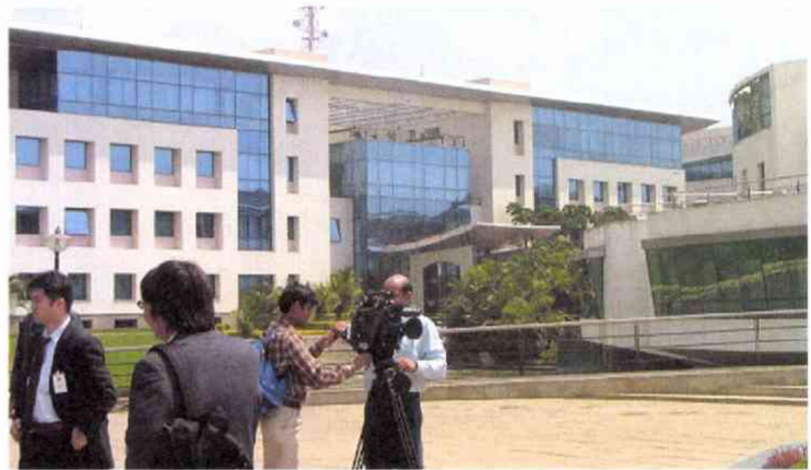
モダンであかぬけしたIT企業・ウィプロ本社 働いている男性も 女性もさっそうとしていた ただし撮影は外観のみでみんなガックリ