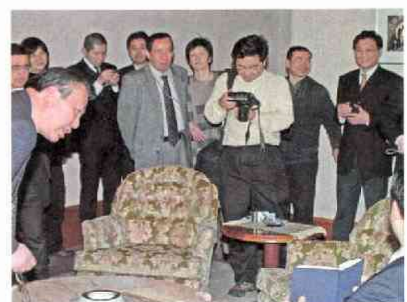
鄧小平副首相の揮ごうと一緒に記念撮影する一行 (クラブ貴賓室 3・29)

2010年の上海万博に向けて、解放日報や上海ラジオなど上海のメディア代表团(7社7人)が、愛知万博を3日間取材したあと、クラブを訪れました。万博の感想は「日本人の皆さんが整然と列をつくって待っているのにビックリ。パリアフリは充実しているけど、外国語案内が少ないのが難点ですネ」と。