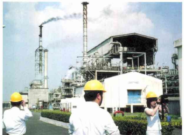
三菱化学と西ベンガル州との合弁会社 ポリエステル 繊維やペットボトル原料を2000年から生産している