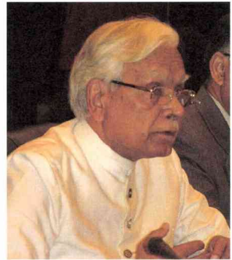
ナトワル・シン外相