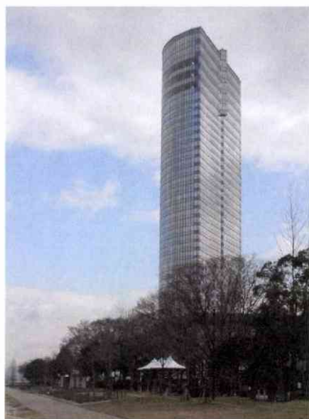
琵琶湖畔にそびえたつ38階建ての大津プリンスホテル 設計は先月死去した丹下健三氏

じ高さにしてほしい」との武村氏の求めに、義明氏は「そうしましょう」と即答した、というエピソードもある。 県内には、ほかにも西武系のスキー場やホテルがある。康次郎氏が生前に買った土地を利用して、事業を起こしたところが多く、地元の人が雇用されている。