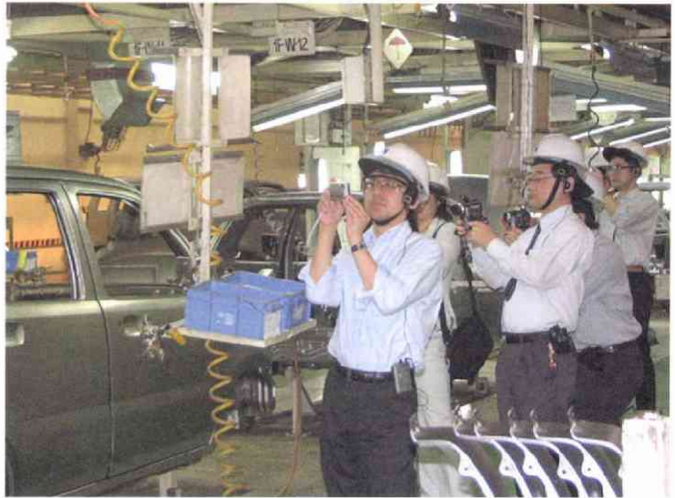
1983年に進出したスズキの子会社マルチ・ウドヨグ（デリー郊外） まだ軽自動車が主流の四輪市場でシェア55%