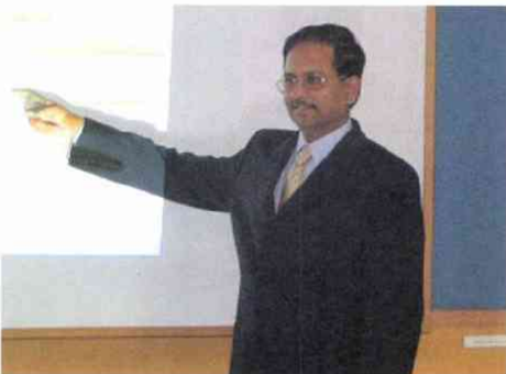
IBMインドのアナスワミ専務のプレ ゼンテーションは秀一だった