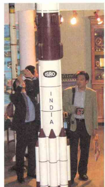
衛星の開発・打ち上げは独自技術 (宇宙研究機構 パンガロール)