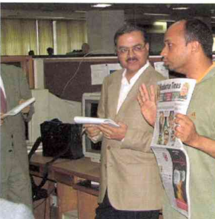
ヒンドスタン・タイムズの編集局で 広告収入の増加で活字も電波も元氣一杯