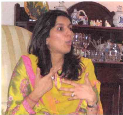
全員を昼食に招いてくれたキロスカ財閥 (トヨタの合併相手)の社長夫人