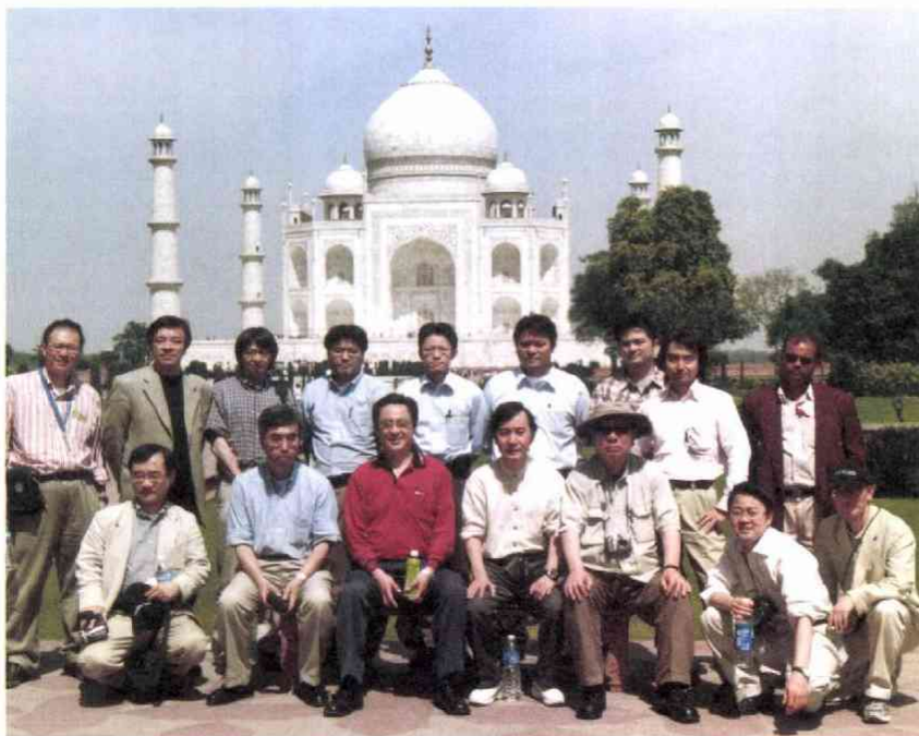
帰国日は早朝5時起床 デリーから特急列車で4時間かかってアグラの「タ ージマハル」へ 1時間観光して5時間かけて空港へ直行 記念写真代は 1人100ルピー(約250円)でした