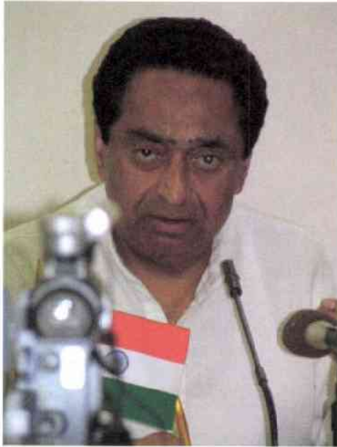
カマル・ナート商工相