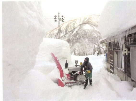
丸ごと雪の中での生活が続く

豪雪の当地でこの冬、クロージアアップされたのが津南町の秋山郷だ。秋山郷は信濃川の支流に当たる中津川流域の地域で、同町と長野県栄村の一部からなる。「平家の落人集落」ともいわれる秘境で、冬場は中津川溪谷を縫うように走る一本の国道だけが同町の中心部と秋山郷を結ぶ生命線だ。1月8日、その国道が雪崩の危険で寸断され、193世帯500人が孤立したのだ。以降、連日のように新聞やテレビに「秋山郷」「孤立」の文字が躍り、大雪に閉ざされる集落の様子が繰り返