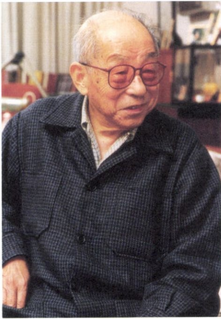
当時91歳。整然とインタビューに答えた張学良氏—台北の私邸で（1993年1月）

頭を、張氏はあくまで「軍人としての良心、責任問題」とする。とはいえこのとき、張氏に正義の兵諫ははじめや処分あってこそ完結すると思うはなかった