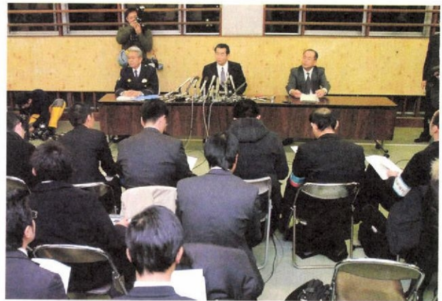
3人の容疑者逮捕について記者会見する宮城県警幹部 =1月9日午前0時15分 仙台市宮城野区の仙台東警察署

記者会は協定を受け入れるに当たり、刑事部長（捜査本部長）の定期的な記者会見を求めたが、協定の締結から解除までの13時間半で、正式会見は1回にとどまった。 文書発表も遅れ、脅迫電話がかかって40分以上たってから発表文が出たこともあった。人質解放の電話が入った時点で発表はなく、その後、人質を保護した時にまとめて発表された。刑事部幹部の非公式のレクでは、容疑車両の特定など重要な事実が隠された。