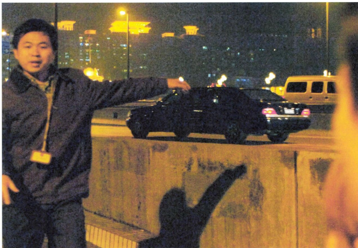
北朝鮮の金正日総書記を乗せたとみられる車の撮影を遮ろうとする私服警察官 (中国広州市内 1. 13)