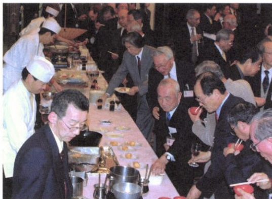
健たんは長寿の源ーアラスカの板さんが目の前で調理してくれる和食コーナーが人気抜群でした