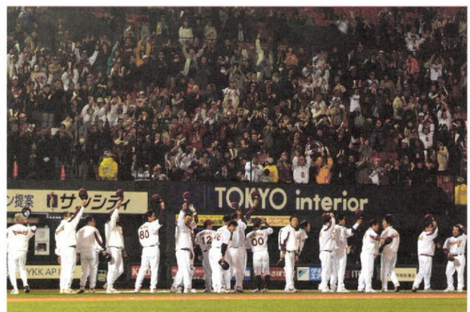
めったにない東北楽天の勝利に、ファンはまるで優勝でもしたかのように歓喜、歓喜＝4.12 フルキャストスタジアム宮城

プロ野球東北楽天ゴールデンイーグルスの星勘定がどうも上がらない。知将の呼び声高く、その手腕が期待される野村克也新監督の目指す野球は今のところ道半ば。地元ファンからは「羽ばたかないイヌワシ」に、ため息が漏れるばかりだ。 健全経営、強いチームづくりとともに、球団運営の柱に地域密着を掲げる楽天。河北新報は今年1月から、このチームの略称を地域に一層根付いてもらいたいという願いから「楽天」から「東北楽天」とした。 だが、この熱い思いはチームになかなか届かない。4連敗、一つ勝つて5連敗、ちよつと勝ったと思うと、