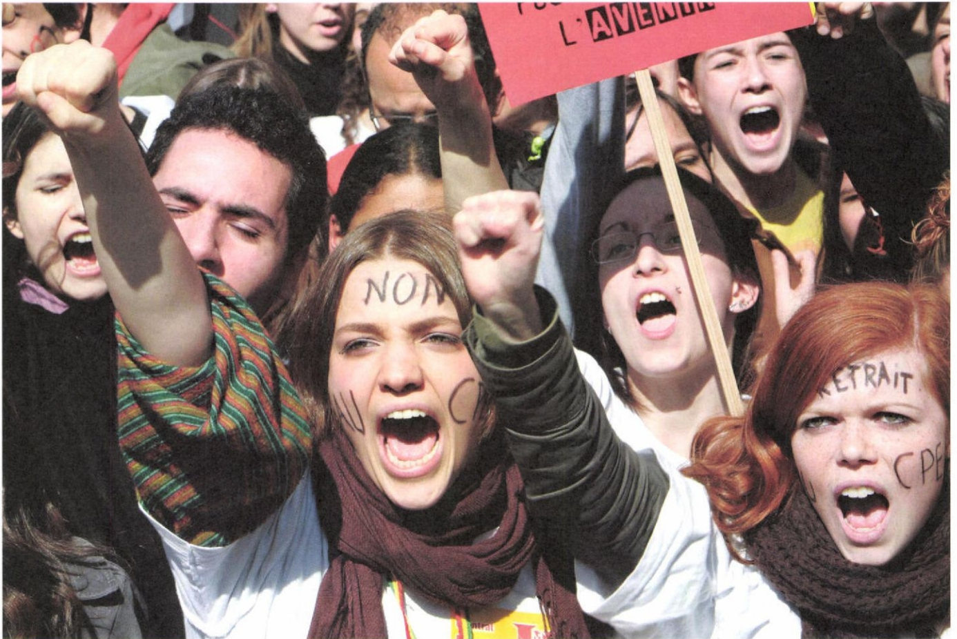
「若者雇用策」の全面撤回を求めて氣勢をあげた学生たち パリ市内 = (4.7)