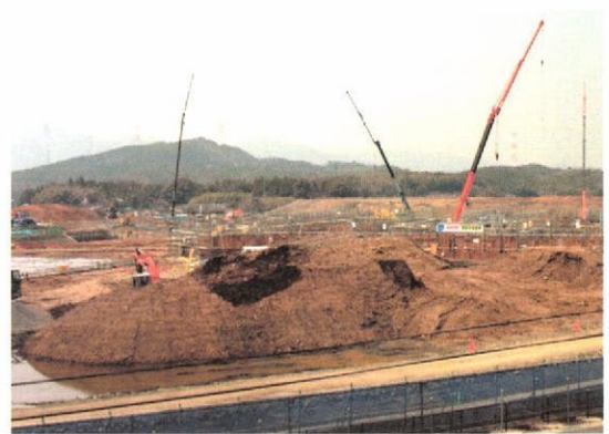
元工業団地で建設が進む「美祢社会復帰促進センター」

市は、刑務所で働く職員や家族500人による消費と生鮮食品や日用品の地元業者からの納入などによる経済効果を年間7億4千万円と試算。パートを含めた新たな雇用も1