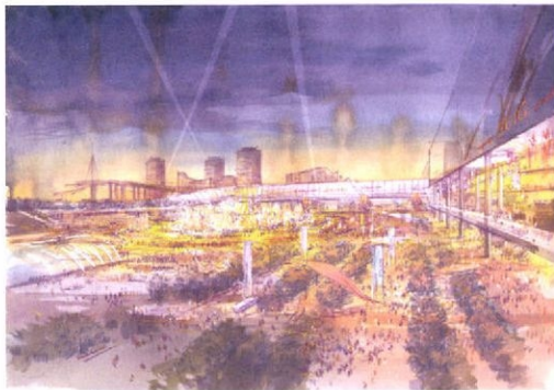
選手の交流の場となるオリンピック広場のイメージ図

そもそも、計画の中核となる埠頭再開発が民間任せでいいのか。埠頭は都心に近い一等地。五輪後の福岡市の都市像を左右する重要な開発なのに、市の理念が見えない。業者が利益に走れば、海辺の景観を遮る高