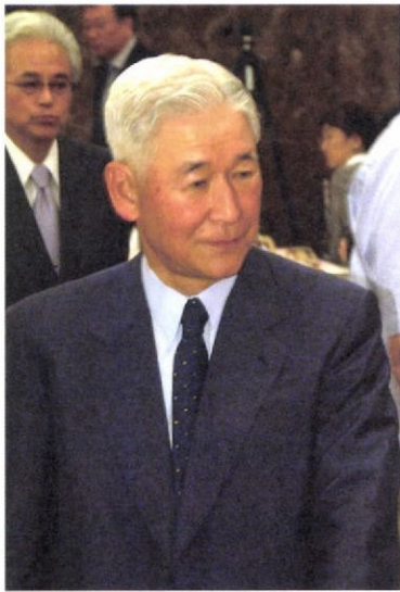
硬い表情で入場する総裁 左は司会の宇治企画委員長

この日取りは、3月20日に決めていた。そのときはゼロ金利政策変更へのタイミングなどを考えると絶好かなあと漠然と思っていた。ところが、昼食会当日の午後に、富士通総研理事長時代(1999・10)に投資した1000万の運用益の詳細を衆院財務金融委員会へ提出することになったため、大騒動に。世の中な