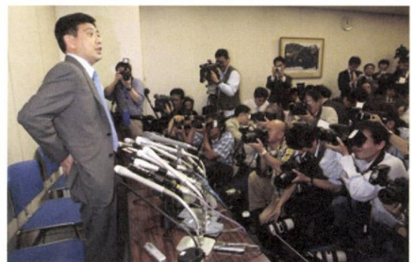
弁明80分—狭い会見室に100人以上の報道陣がかけつけた(6.5 東証で)

会見の内容については、すでにテレビや新聞で詳しく紹介されているため、ここではあえて触れない。村上元代表の発言に対しては、人によって様々な受け止め方があるだろう。ただ、はっきり言えるのは、経済関係の記者会見としては、「社員は悪くありません」というセリフで有名な野沢正平・山一証券社長の記者会見(1997年11月24日)以来の、歴史