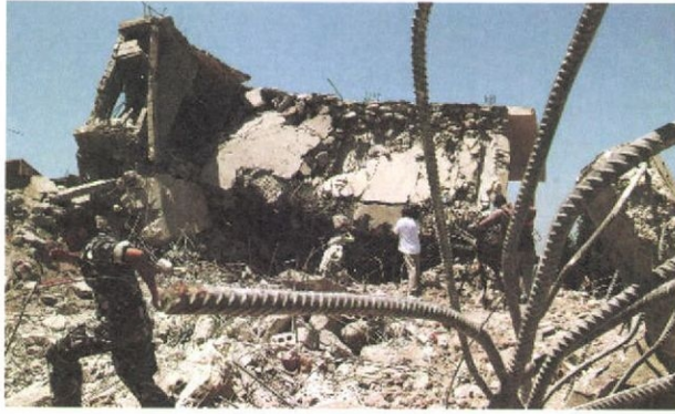
建物の壁は完全に崩れ鉄骨が折れ曲がっていたカナの空爆現場 多数の民間人の犠牲者が出た(7.31)

7月31日午前7時半、ベイルートから地中海沿岸沿いにレバノン南部へ延びる幹線道。我々以外、車の影はない。イスラエル軍の「48時間停戦」の一報から8時間。前日の空爆で54人が死亡したとされた(後に約30人死亡と判明)南部カナへ向かった。レバノンに来て3日目。戦争取材の経験もない。安全策を考えたが思い浮かばず、心だけがはやる。激しい空爆を受けた幹線道は封鎖され、山側の唯一の迂回道を通る。黒こげの工場や給油所が続くサイダ南郊から、バナナ畑に囲まれたリタニ川が見えてくる。川向こうの道は、この