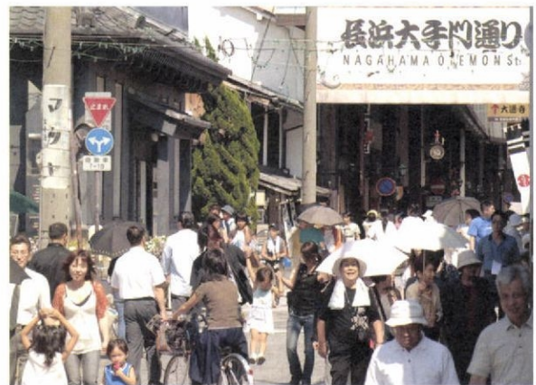
平日でも多くの観光客でにぎわう長浜市中心部の黒壁スクエア

「近江を制する者は天下を制す」ともいわれ、日本の歴史の転機に数々の舞台となった湖国・滋賀県。戦国時代、織田信長は姉川の合戦で勝利し、安土に城を築いた。信長の家臣だった豊臣秀吉は、長浜の地で初めて城持ち大名となった。長浜城は今も「出世城」と呼ばれる。 秀吉の家臣の山内一豊もまた、湖国の歴史に名前を刻む戦国武将の一人だろう。派手さはなく、きまじめな男。あるいは一豊よりも、夫を支えた妻千代のほうが後世に名を残しているかもしれない。 琵琶湖の東北部に位置する湖北地