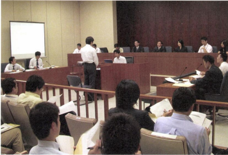
公判（東京高裁806号法廷）