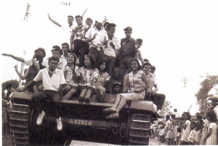
スカルノ大統領支配終幕——クーデターを支持しパレードする若者たち (1966. 3. 12)