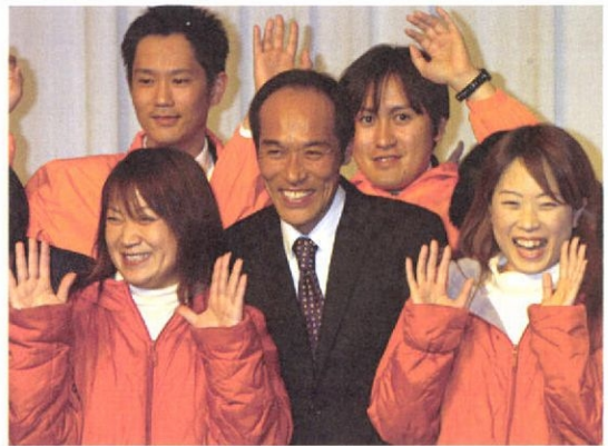
出直し知事選で圧勝した東国原氏 (1. 21)

宮崎では、県選出国会議員5人のうち4人、県議42人のうち32人を自民で占める。この寡占状態を自民友好経済10団体と称する建設業協会、農協、商工会議所、商工会などの主だった経済団体が選挙の際に下支え