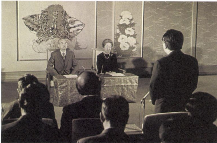
昭和天皇・香淳皇后記者会見で理事長として代表質問を行った (1975. 10. 31 皇居「石橋の間」)