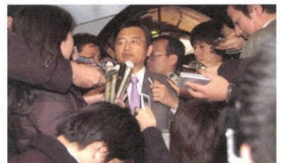
出馬表明第一声? 浅野氏のプレスセンター到着を50人近い報道陣が待ち受け質問。都知事選について「気持ちはフリーズ(凍結)からフリーズへ変わってきた」(2.28)

照会先：フィジー政府観光局 Tel：03-3587-2561 http://www.bulafiji-jp.com