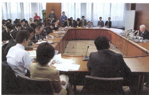
身内に反対もあった今回の利上げ決定後に福井総裁が会見(2.21)＝時事

現実しかし、理想とは程遠いところにある。新法導入前後から経済は未曾有の危機に陥り、前例のない超金融緩和を迫られた日銀は余裕を失いがちとなった。組織内の慌しさは「何かやりそうだ」との雰囲気醸し出し、マスコミに事前報道される隙(すき)を与えた。さらに、政策運営のロジックは迷走し、金融市場を驚かさず政策判断をたびたび行な