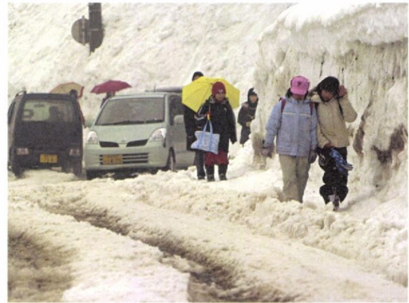
いつもはこんな風景なのに…昨冬の青森市内。通学路も雪で埋まった (2006. 2. 14)

財政難に悩む自治体にとっても、道路の除雪費が抑えられるメリットは大きい。昨冬まで2年連続の豪雪で青森市の除雪費は予算をオーバーし、決算額は2004年度が約30億円、05年度が約23億円。道路除雪は行政に対する雪対策の要望の大半を占めるが、春になると消えてしまう雪に大金を投じなければならぬ自治体の立場は複雑だ。