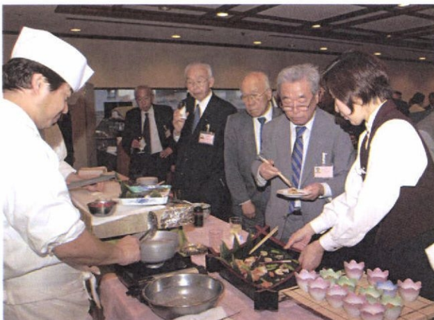
和食コーナーでは初夏の味覚「はも」が人気でした