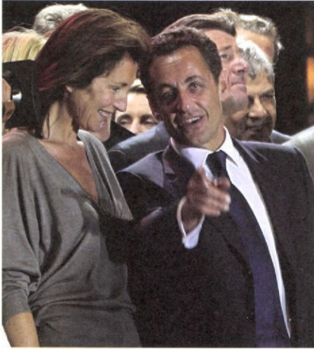
セシリア夫人と勝利を祝うサルコジ氏＝パリ市内コンコルド広場(5.6)