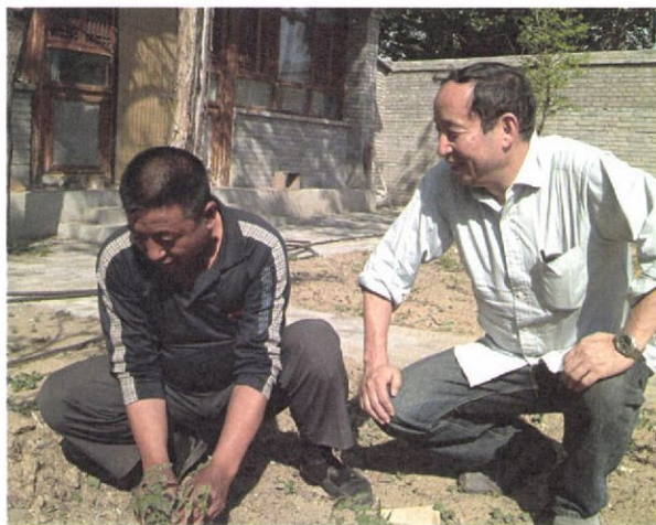
北京郊外の農家で農民の話を聞く

を組み立てていく巧みなやり方には定評があります。中国と付き合ってきた人々が「友好人士」の枠から、