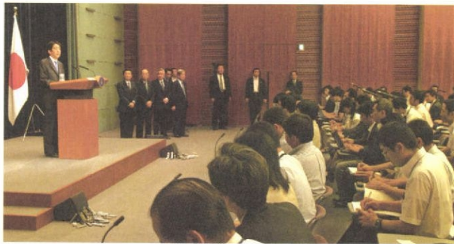
官邸での会見—首相の辞意表明に大勢の記者がかけつけた (9.12)

だった。首相公邸で側近の秘書ら数 人に「明日辞意を表明する。あらゆ る方策を考えたが他に道はない」と 打ち明けた。秘書らは涙ながらに説 得を試みたが、安倍氏の決意は揺る がなかったという。