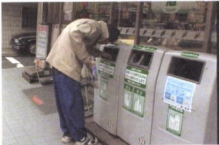
ホームレスの若者に半年間密着した

今回の「顔が出ないのなら応じる」という申し出が多かった。ホームレスの若者も当初は、顔出しの取材をことわっていた。しかし、何度も通って日頃の生活をともにし、この問題を世に問う意義を伝えるうち、2カ月近くたって、撮影を承諾してくれた。