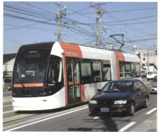
開業1年半 市民の足として定着したポートルム

富山ライトレールは2006年4月29日に開業し、まもなく1年半を迎える。7色の車両の「ポートルム(愛称)」すべてに低床型を導入、全電停をバリアフリー化し、デザインを統一した全国初の本格的LRT(次世代型路面電車システム)だ。今では富山市民の足として定着し、予測を大幅に超える利用がある。視察や観光利用で経済効果を生み、沿線では民間投資の動きも出始めた。 利用者が減り、廃線が懸念されていた富山市北部地区を走るJR富山港線を市が譲り受け、既存の線路を使う6・5キロ区間に路面電車区間