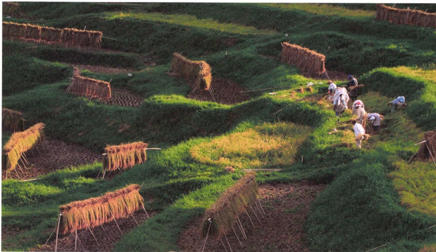
千葉県鴨川市の大山千枚田 刈り取られた稲穂が夕日に輝く (9. 8)