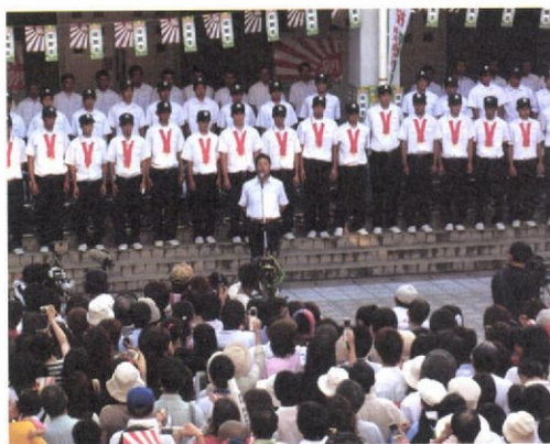
多くの市民が駆けつけた佐賀北ナインの凱旋

9月22日。甲子園で劇的な逆転優勝を果たした日からちょうど1カ月後。新チームとなった佐賀北高校ナインが秋の九州地区大会佐賀大会1回戦に登場した。 会場の嬉野市のみゆき球場は、学校がある佐賀市から車で1時間以上かかる距離にあるが、地方大会の1回戦としては県外組を含む。異例の約500人の観客を集めた。地元佐賀市であった続く2回戦は約1000人。優勝直後の異常ともいえない「佐賀北人気」をうかがわせた。 県立普通高校の快挙。甲子園取