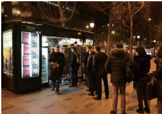
銃撃事件後、最初のシャルリ・エブド発売日となった1月14日、暗いうちからパリ市民がキオスクに列を作った(シャンゼリゼ通り/共同通信社提供)

緊迫した状態の中、食料品店の立てこもり犯は前日の女性警官銃撃の容疑者であることが分かり、「印刷会社の2容疑者に手を出せば人質を殺す」と当局を脅していることが判明。容疑者は最初から連続テロを計画し、連携をとって動いていたとい