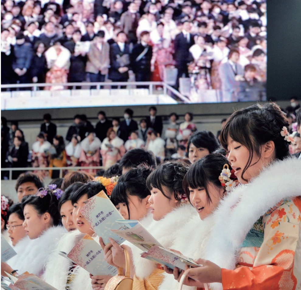
阪神・淡路大震災の年に生まれた歌「しあわせ運べるように」を歌う新成人たち =2015年1月12日、ノエビアスタジアム神戸