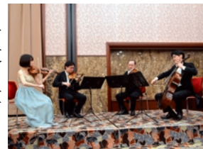
(8ページに「クラブゲスト」)

クラシック生演奏付きの会合をクラブが主催するのは初めてだった。東京都交響楽団から、じゅうたん敷きの会場で、厚地の緞帳の前で演奏すると音が吸収されてしまう、と事前に指摘があった。