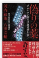
毎日新聞社 1512円(税込)