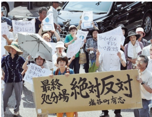
「反対」の紙を掲げる町民ら／2014年7月30日／塩谷町役場

から反発が起こった。同町上寺島(かみでらしま)の国有林が選定されたことを伝えるため、役場を訪れた井上信治環境副大臣(当時)に対し、詰めかけた住民100人以上が「絶対反対」「塩谷を守れ」と声を上げた。見形和久町長も「明確に反対する」と述べ、説明会の受け入れを拒否している。