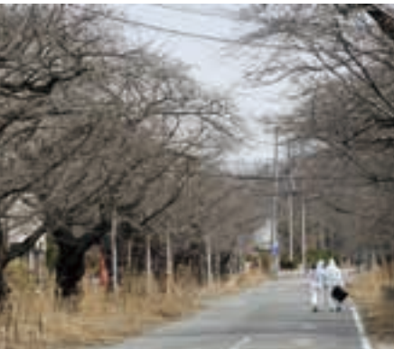
上・桜の名所として知られた富岡町夜の森地区。帰還困難区域となり、手つかずの桜並木には雑草が生い茂る=2013年3月 下・同区域に通じる道路にはゲートが設置され、今も立ち入りや取材には許可が必要=2014年3月