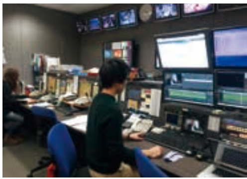
外信部国際衛星班 24時間、世界中から入ってくる映像素材に対応している

こうした報道局の判断を支えてくれるのが、海外からのあらゆる映像を最初に確認する外信部国際衛星班だ。「イスラム国」はその後も、ヨルダン人パイロットや異教徒の殺害映像を公開しているが、それは突然、インターネット上に公開されることがほとんどだ。国際衛星班は人質の殺害映像