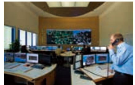
在ベルリンの送電会社「50ヘルツ」のコントロールセンター