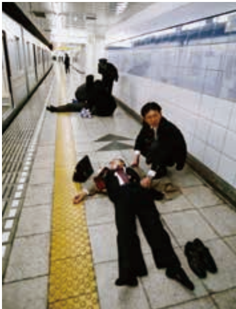
事件発生直後の地下鉄神谷町駅ホーム。倒れ込んだ男性に乗客が寄り添う。

長く傍聴したオウム裁判の判決で印象に残っている裁判官の言葉がある。「師を誤るほど不幸なことはない、被告もまた、不幸かつ不運だった」。2006年9月、地下鉄サリン事件の実行犯、林泰男被告に一番で極刑を宣告した東京地裁の木村烈裁判長の言葉だ。人生をやり直すことのできない弟子たちの無念さを判決で代弁したように思えた。 解脱や悟りを求めて出家した青年たちがなぜ、人の命を奪ったのか。根本的な疑問に迫りたいと、地下鉄サリン事件や坂本弁護士一家殺害の実行役らと面会や文通を始めた。地下鉄サリン事件の実行犯だった広瀬健一死刑囚など同世代もいた。学生時代に何かの歯車が狂っていたら、