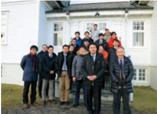
レイキャビク市内のホフディ・ハウス前で。1986年10月、レーガン、ゴルバチョフによる米ソ首脳会談が行われた会場。レイキャビク市の迎賓館として現在も使用されている

今回は全国紙のほか原発立地県の県紙など14社、16人が参加した。主眼を、スウェーデンの原発、高レベル放射性廃棄物処分、アイスランドの地熱発電、ドイツの脱原発から再生エネルギーへの転換に置いた。