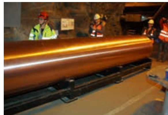
オスカーシャムにある高レベル放射性廃棄物研究のためのエスポ岩盤研究所 バスで深さ450メートル地点まで下り、職員の説明を受けた

てようやく着手された過酷事故対策に、かなり前から取り組んでいた。処分先はまだ決まっていない研究用や医療用の放射性廃棄物も受け入れていた。各原発の使用済み燃料を集中管理する貯蔵施設もつくられていた。チェルノブイリ原発事故で汚染された経路が、原子力分野での取り組みを加速させたのだろう。同国では10基の原発が稼働中で電力の4割を賄うが、いずれ原発はなくなる方向にあるという。2029年から高レベル放射性廃棄物の処分場が稼働すれば、当面は後始末の人材をどう確保していくかが課題だという。原発を使ったことによる苦勞は続く。日本の今後をあらためて思った。