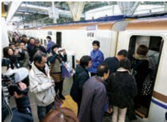
一般向け試乗会で新型車両W7系に乗り込む参加者 (2月7日、JR金沢駅)

時間が飛んだような感覚に襲われた、と言えば大げさだろうか。2月5日、金沢―長野の開業区間で行われた北陸新幹線の報道向け試乗会での体験である。在来線を乗り継いで3時間半以上かかる長野に1時間半ほどで到着した時は、驚きを通り越して不思議だった。 新幹線による最大の利点は、アクセスの向上である。近年の先行事例を見ると、2010年に全線開業した東北新幹線は東京―新青森で約40分、11年に全通した九州新幹線は博多―鹿児島中央で約50分の時短効果があった。 そう考えれば、北陸新幹線の開業は他地域に比べてもインパクトが大