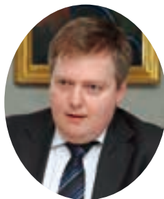
アイスランドのグンロイグソン首相。2013年に38歳で首相に就任。留学が盛んな国として知られるが、本人もオックスフォード大などで学んだ