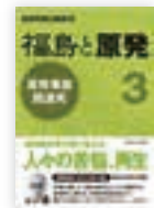
早稲田大学出版部 3024円