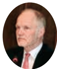
省エネルギー事務次官 経済バーネケ

薄い霧で太陽光発電の発電量が予想値を大きく下回り、欧州から買える電気を全て買って電力不足をしのいだと明らかになった。電力の系統網が国境をまたぐ欧州だから対応できた。島国の日本では大停電になりかねない。