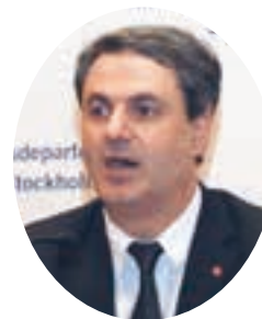
スウェーデンのバイラン・エネルギー担当相。少年時代にトルコから移住。移民社会を象徴するように24人の閣僚のうち5人が移民