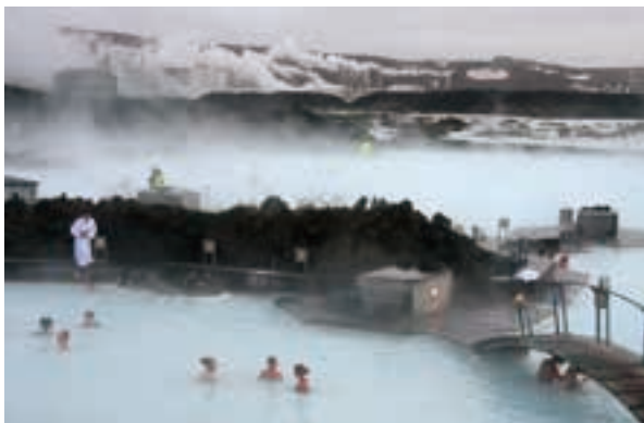
アイスランドの「ブルーラグーン」。スバルツェンギ地熱発電所(中央奥)の温排水を利用した温泉保養施設。入場料は35ユーロ(約5千円)から(右顔写真とも中日新聞社提供)