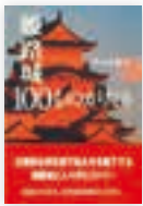
神戸新聞総合出版センター 1728円

気楽なお城のコラム。趣味が高じて歴史ものばかり書くようになって、足元の姫路城をまた取り上げた。なぜ白すぎるのか、そもそも城とは何かといった自問から発して新聞連載した短文100篇をまとめたもので、いわば「お城のコラム」。独特の建築美はもちろん、地政学的環境、城主の政治、城下町の人と暮らし―これらを総理解することで初めて世界遺産姫路城の全体像が分かるという日ごろの思いを込めて綴った。平成の大修理を終え、3月27日にグランドオープンする姫路城をご覧になる方の軽いガイドにもなれば…。