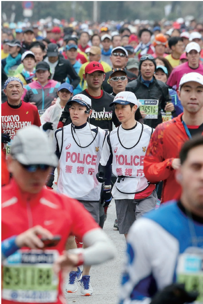
東京マラソンで市民ランナーと並走しながら警戒する警視庁の「ランニングポリス」