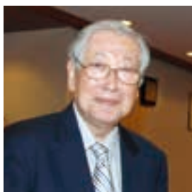
朝日新聞出身、「天声人語」筆者 栗田 巨

すわ・まさと氏 東京都生まれ。東大文学部卒。1953年毎日新聞入社。学芸部、政治部、外信部などを経てジュネーブ、パリ各支局長、学芸部長、論説委員などを歴任。79年から2002年まで23年間にわたり、朝刊1面コラム「余録」を執筆した。1990年度日本記者クラブ賞受賞。「諏訪正」のペンネームで戯曲の翻訳や評論などでも活躍し、著書に『ジュヴェの肖像』がある。2月8日死去。享年84。写真は2012年5月の会員懇親会で。