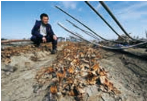
上・津波でイチゴ栽培施設が全壊し、ぼうぜんとして座り込む農家の男性＝山元町 2011年4月1日 下・国の復興事業で整備した生産拠点「いちご団地」で営農を再開した農家ら＝巨理町 2015年1月26日