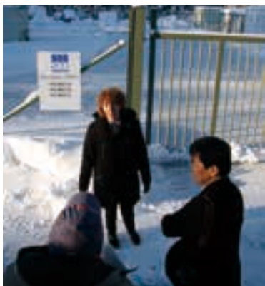
フォルスマルクの高レベル放射性廃棄物最終処分場建設予定地。同地にはすでに低・中レベル廃棄物処理場がある(代表取材)