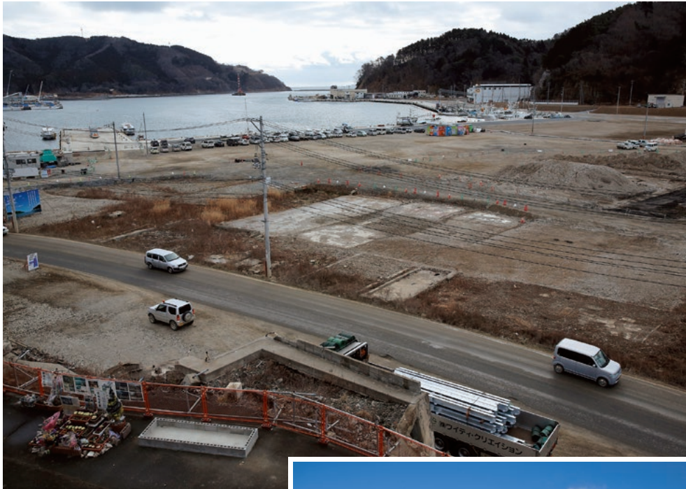
▲2015年2月17日 ※16～19ページに 『3.11から4年』特集

東日本大震災から4年。津波で横倒しになった宮城県女川町のビル「江島共済会館」は震災遺構として保存も検討されたが、耐久性や保存費用などの問題から昨年末に解体され（写真下）、現在は更地（写真上・中央部）に。その左下には遺族が作った花壇がある。