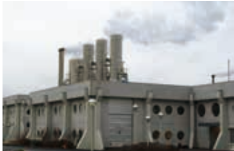
スパルツェンギ地熱発電所。富士電機製のタービンが使われている

この国の電力は水力が約7割、地熱が約3割と全て再生可能エネルギーからのものだ。地熱発電の過程で出る温水や地下水を利用した地域冷暖房の普及も進み、ほぼ90%で地熱が利用されている。数ある取材先の中で何といつても興味深かったのは、スパルツェンギ地熱発電所に隣接する巨大な地熱スパ「ブルーラグーン」だろう(15ページに写真)。