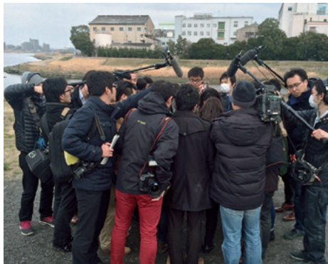
遺体が発見された多摩川の河川敷に花を供えようと訪れた人を多くの記者やカメラマンが取り囲んだ

として個人情報さらされた。「名誉棄損やプライバシー侵害に当たる可能性が高い」少年法の趣旨に反する行為」と指摘する弁護士もいる。