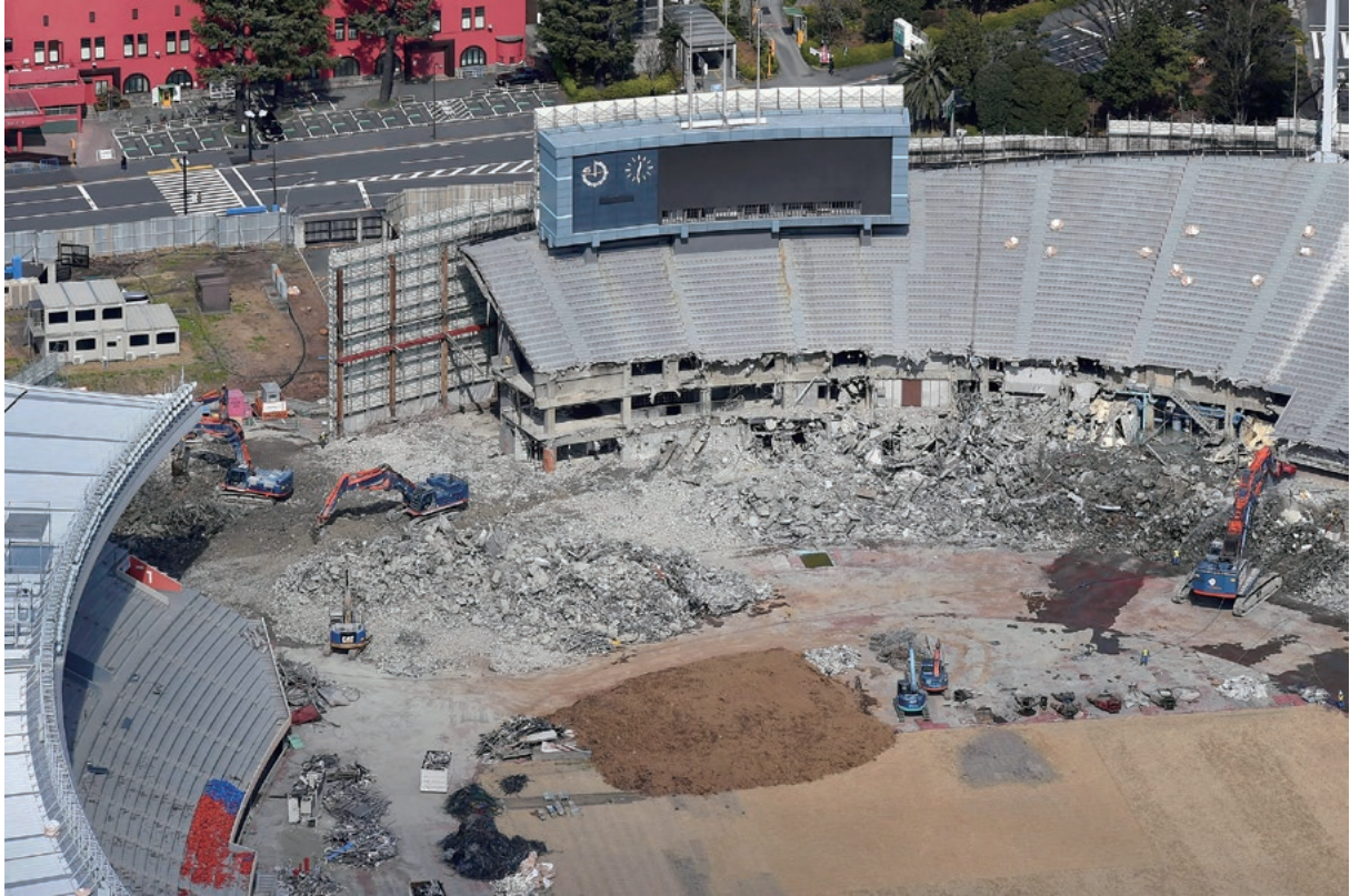
解体工事でスタンドなどの取り壊しが始まった国立競技場＝3月5日、東京都新宿区で