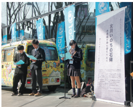
第3回国連防災世界会議のパブリック・フォーラムで、命の尊さや絆を育む大切さを語る女川中学校の卒業生(3月14日/仙台市青葉区)

3月からは「復興の階段」のタイトルでインタビュを連載している。「復興のゴールを10段階目として現在何段階目か」と問いかけると、答えは人によって大きく異なる。10カ