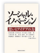
関西学院大学出版会 2592円