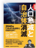
時事通信出版局 3024円

シアター・イメージフォーラム(東京・渋谷)ほか全国順次公開