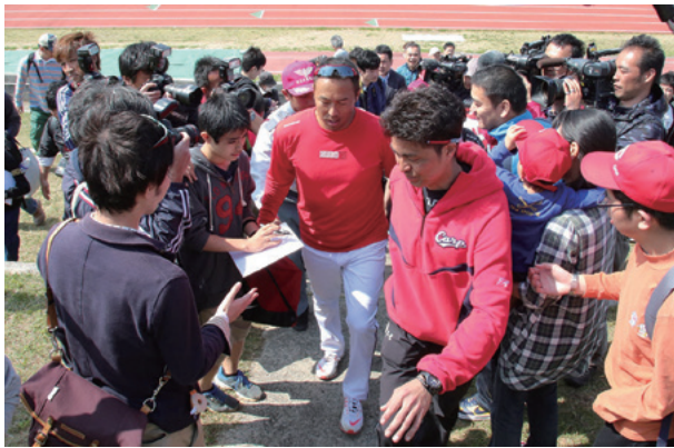
沖縄キャンプでファンに囲まれる黒田投手(中央)(2月11日/沖縄市陸上競技場)

ファンの前で、カープを相手に投げた姿が想像できなかった」として広島に残留した。あの時、「お金では動かない男」と知ったファンは、今回の復帰劇で再び歓喜に震えた。多くの人々の心を揺さぶったと言われるが、広島ファンは同時に感謝の念を強く抱いている。