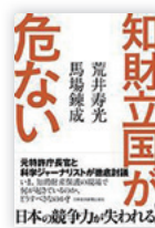
日本経済新聞出版社 1944円

知財ブームを振り返る 「知財立国」が叫ばれ、一種のブームのように言われてから10年たつた。あのころ、知財畑にいたプロ集団は「知財、知財とどこへ行っても叫んでいるが、これは知財バブルだ」とも言っていた。結局、言われたようにバブルだった。知財立国に変革ができないうちに、韓国、中国などほとんど変革して、部分的には日本を追い抜いていった。なぜそうなったのか。ブームをホンモノにできなかった日本の特殊事情を検証したものであり、解決策も提言した。