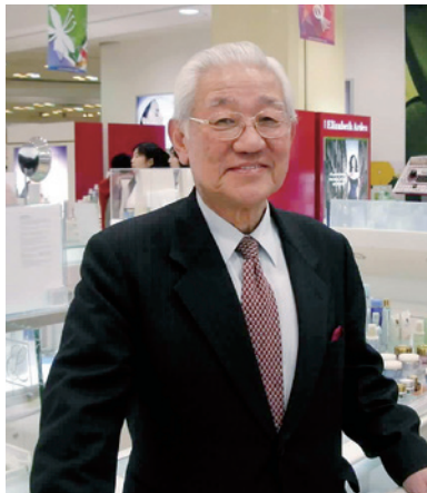
ソウルのロッテ百貨店本店で（2005年）

白眉は、店員による深々とした「日本式おじぎ」の導入だろう。「見知らぬ人に軽々しく親しい態度を見せない」という儒教的慣習の抵抗に遭いながらも、客への感謝の意義を説き自ら実践して、無愛想だった店員の接客態度を百八十度変えた。普通