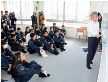
教育復興の拠点として期待が高まる中、学校では「教育復興応援団」の一員でもある平田オリザ氏による授業も始まった

事故収束作業が進む東京電力福島第1原発から南に20〜30kmの場所に位置する福島県広野町に4月、原発被災地の教育復興の柱として期待される県立中高一貫校「ふたば未来学園高校」が開校した。注目を集めた入学式から2カ月が過ぎ、真新しい制服に身を包んだ生徒たちの姿も広野の街並みになじみ始めた。 原発事故後、広野町を含む双葉郡8町村の子どもたちは避難先での通学を強いられ、教育環境は大きく悪化。避難先にサテライト校を開校し