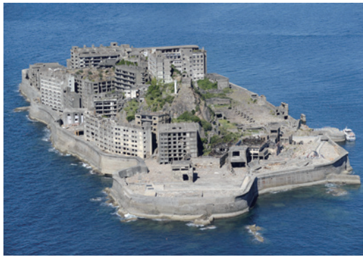
「軍艦島」の通称で知られる長崎市の端島炭坑も登録勧告された

韓国は「登録阻止」を公言し、大掛かりなロビー活動に走った。今年4月には朴槿恵大統領自ら、世界遺産委メンバーのペルーやコロンビアを訪問し、登録に反対するよう要請。勧告前には、各国駐在の韓国大使館員らが、その国の諮問機関メンバーである研究者らに直接圧力をかける「禁じ手」にも出た。外務省関係者は