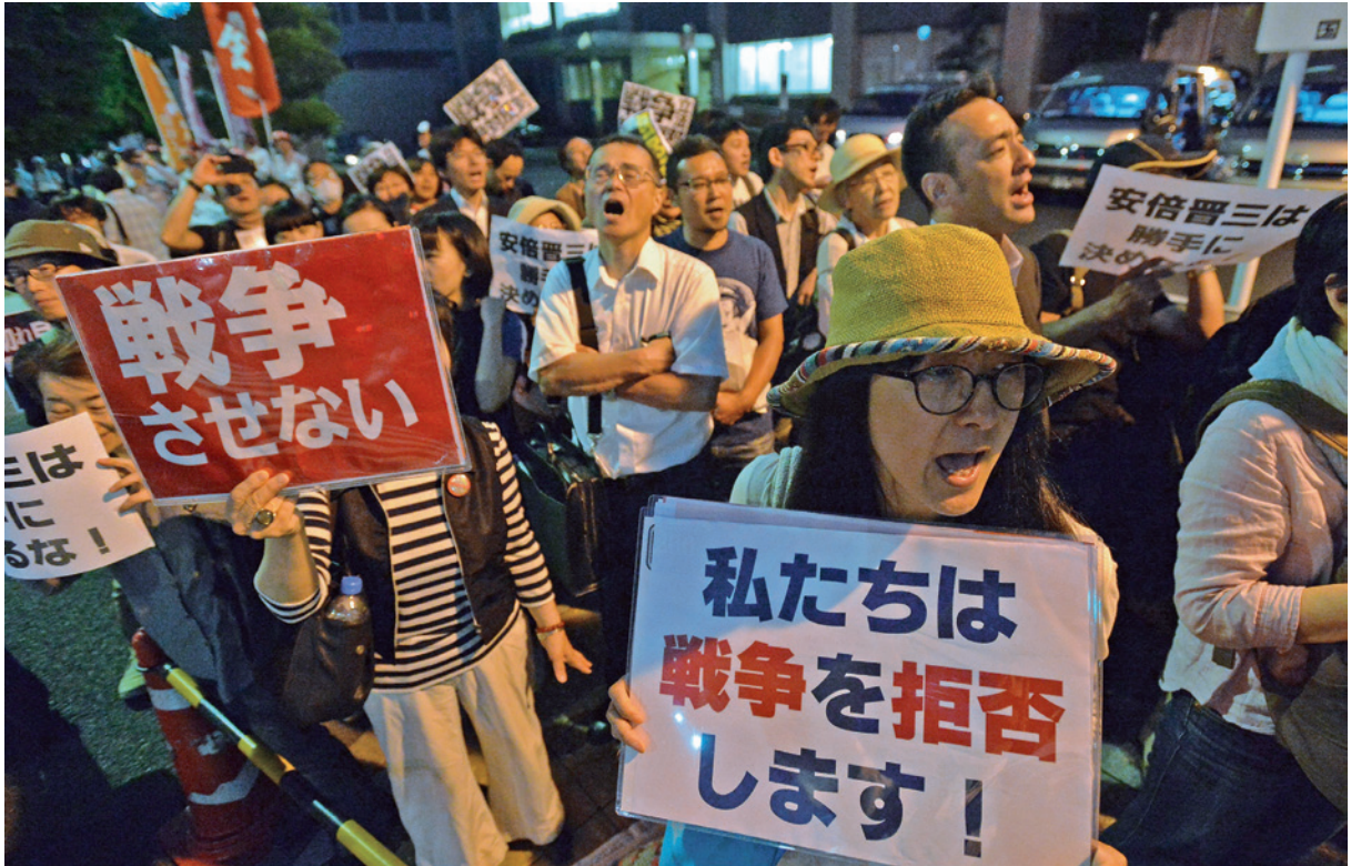
安全保障関連法案の閣議決定に反対し、首相官邸前で抗議行動をする市民ら＝東京都千代田区、5月14日