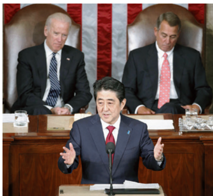
日本の首相として初めて米議会の上下両院合同会議で演説する安倍首相(4月29日/ワシントン)

米国人にとって勇敢の証しである硫黄島での戦いにもつわる日米の関係者をゲストに迎え、演説の表題(「希望の同盟へ」)にオバマ大統領を表す代名詞だった「Hope」を盛り込んだ。側近の議会演説の下調べ、経