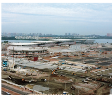
バツハ地区の五輪パーク 休日返上で建設が続いている

その危機感から準備の遅れが課題と現地からレポートしたが、不安はすぐに的中した。自信満々だった会見の数日後、工事の進捗率が98%とされたゴルフのテスト大会の延期が決まったのだ。新設会場のテスト大会はほとんどが来年1月以降で、地