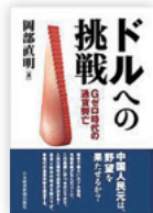
日本経済新聞出版社 1944円