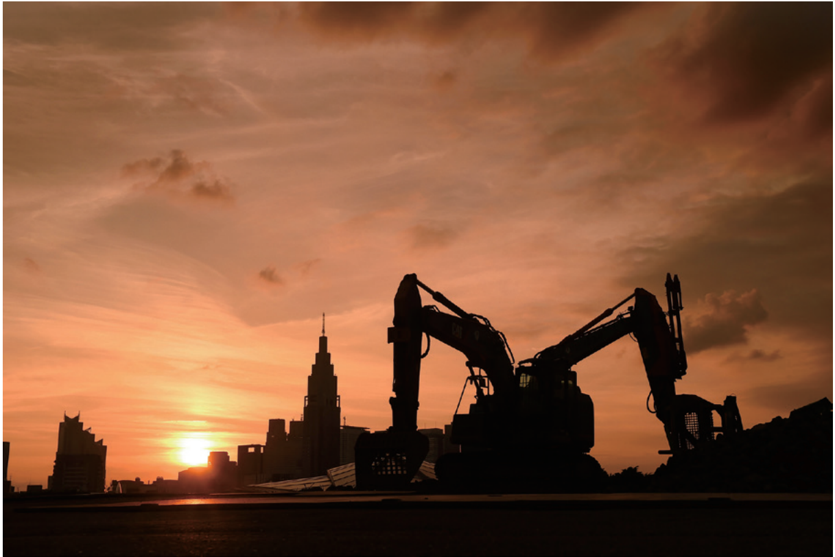
解体が進み国立競技場は姿を消した。視界が開けて、代々木や西新宿の高層ビル群が見える = 6月29日 東京都新宿区