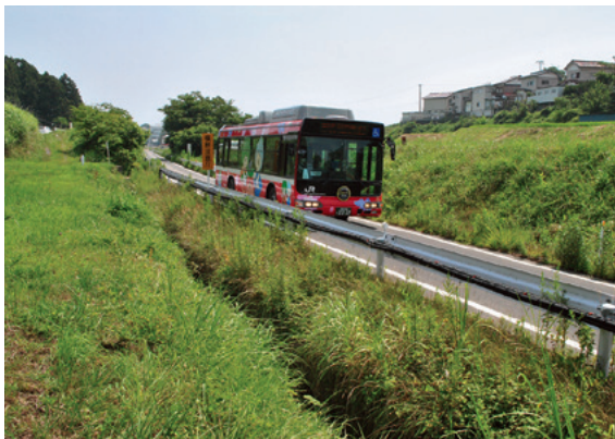
鉄路に代わって運行されるBRT

東日本大震災から4年半を迎える。気仙沼魚市場へのカツオなど活発な水揚げが続き、復興に向かって確実に歩んでいる。震災以降続いている国内外からの支援のおかげであり、あらためて感謝したい。その一方で、気仙沼市、南三陸町でいまだ約1万人が、仮設住宅暮らしを余儀なくされており、住宅再建など思うように進んでいないのが実情である。 大震災では気仙沼市で1136人、南三陸町で620人が死亡し、今も行方不明者は、気仙沼市で221人、南三陸町では212人いる。