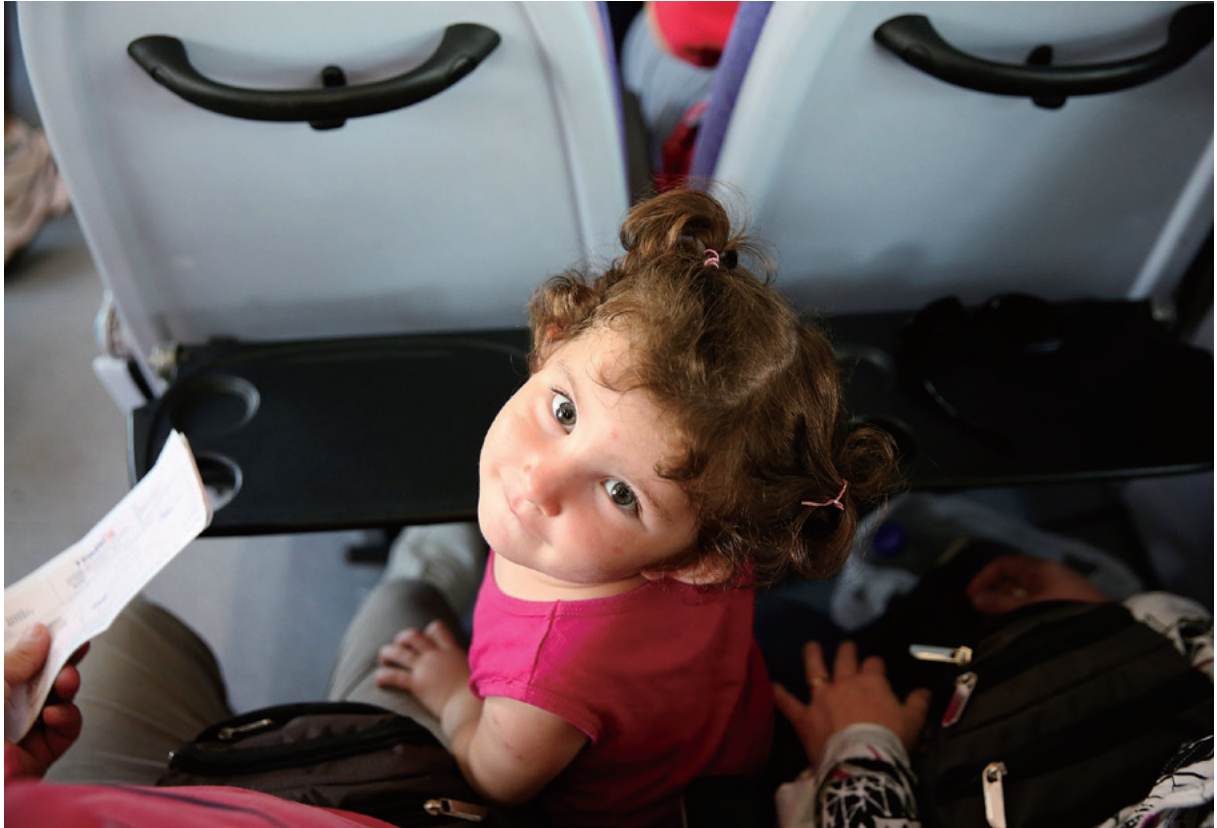
アテネからギリシャ北部テッサロニキ行きの列車に乗ったシリア難民の少女 = 7月26日 ギリシャ・アテネ