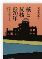
出版 リベルタ 4320円

「使えない核」で威嚇する核抑止 戦略とは？ 広島・長崎の後も核を 手放さないた めのフィクシ ョンだった。