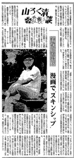
インタビューが掲載された「山ろく清談」

妹の名前はウランだった。当時、原子力は「平和利用」が強調され、21世紀への夢の象徴だった。アトムも時代の空気を映し出していたのだろう。