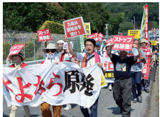
再稼働に抗議し、川内原発周辺をデモ行進する人たち(8月9日)

を集める中で、地元の思いは複雑だ。原発帰りの象徴にされて戸惑う雰囲気もある。そのことが、かえって正直な民意を見えにくくしている気がする。