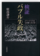
書店 岩波 3024円