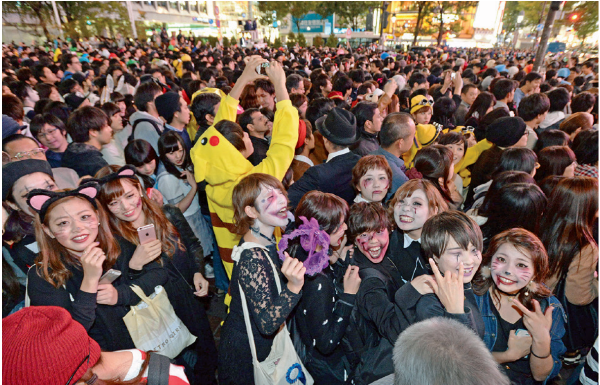
思い思いの仮装で＝東京・渋谷駅前、10月31日