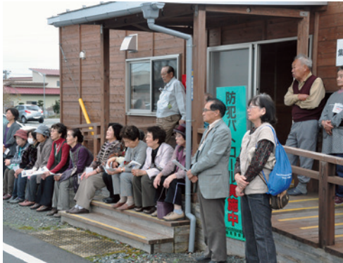
避難先の仮設住宅で候補者の演説を聞く浪江町民 (2015年11月9日/福島県南相馬市)

東京電力福島第一原発事故により全町避難が続く福島県浪江町で11月15日、原発事故後初めて選挙戦となった町長選(2011年は無投票)が投票された。現職と2新人の3候補者のうち現職の馬場有氏(67)が有効投票数の7割近い得票数を集め、3選を果たした。これまで進められてきた町の復興施策が支持された形だが、町民が県内外で避難生活を送る中の前例のない選挙は候補者、有権者ともに戸惑いながらの戦いとなった。