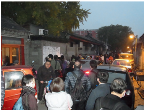
第39中学校近くの前門(フートン)で。幼稚園のお迎え時間と重なり身動きがとれず

の「本音」に迫れるのか、考えさせられることが多かった。四川大地震の被災地を訪れた時、地元政府の担当者から震源地近くで飲食店を営む男性に取材するよう薦められた。大切な家族を失いながら、「政府のおかげで良い暮らしができています」と話した彼が、沈黙し、表情を曇らせる瞬間があった。本当に言いたいことは別にあつたのでは、と感じた。言葉の裏にある本心を聞きたかった。