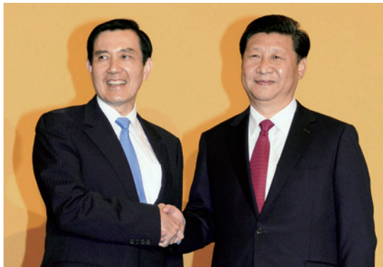
66年ぶりの握手 習近平・中国国家主席(右)と馬英九・台湾総統(11月7日)