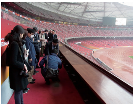
08年北京五輪でメイン会場となった「鳥の巣」。22年冬季五輪でも開幕式が行われる。取材団がいるのは今年の世界陸上で習近平国家主席が開幕宣言をした場所

際ルール」を世界に認めさせようという意欲を、外交部や中国公共外交協会幹部の話から感じた。現在、アメリカと並び立つ中で、中国は自分たちのスタンダードを全面的に押し出し、新しいルールで欧米に対峙しようとしている。 文化面でも「孔子学院」を通じて自分たちの文化を世界に広めることに努力し、国内では海外の中学・高校の留学生を積極的に受け入れて大学にも進学させている。取材団は、北京市第39中学国際部を訪問しインドネシア、タイ、韓国などから来ている生徒にインタビューした。