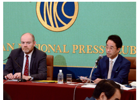
マーク・トンブソン・ニューヨークタイムズ社長 会見(9.25)を司会する西村企画委員長

ドイツとイスラエルに派遣した取材団は、両国の和解がなぜ可能だったのか、答えを求め20人を超える人にインタビューした。取材団の1人