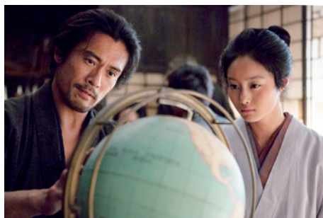
試写室 海難1890 (11.6) 日本・トルコ合作 2つの実話が紡いだもの

1890年、日本を親善訪問したオスマン帝国の軍艦エルトゥールル号は帰途、暴風雨に遭い、和歌山県の大島樫野崎で座礁し、機関が爆発して沈没する。死者は500人を超え、助かった乗員は69人。大勢の外