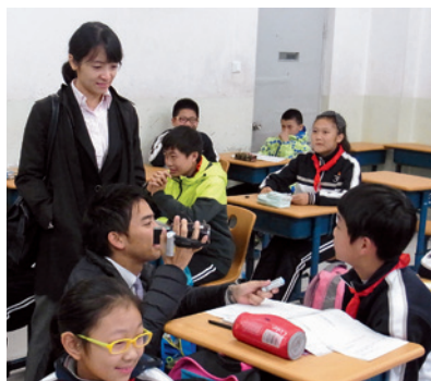
北京市第39中学校「道徳」の授業が終わったばかりの1年生に、九州朝日放送の諫山記者がマイクを向ける

さらに、3年前に立ち上げた公共外交協会では自国のイメージアップを図るなど、幹部層は新たな中国像を作ることに熱心に取り組んでいた。今回の7日間の旅を通して、名実ともに世界のトップとしての地位を固めながら、その影響力を強めようとする中国のアグレッシブな姿を見ることができた。