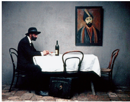
試写室 放浪の画家 ピロスマニ (11.2)

概要、こうある。 ①1862・5?②1918・4・7?グルジアの画家。美術教育は受