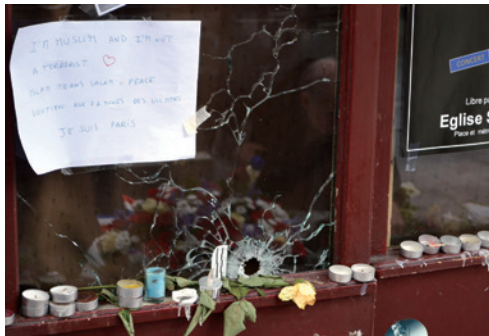
襲撃を受けたパリのバー「カリオン」の窓ガラスには弾痕とメッセージが(11.24)

テロリストそれぞれの軌跡を追う作業に、自分なりに取り組みたいと思う。社会学や心理学の専門家、カルト対策に携わる人々との協力も必要になるだろう。その営みの向こうに、テロを防ぐ糸口が見えてくるに違いない。