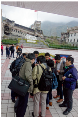
映秀鎮の当時の様子を見学できる。震源地・四川大地震の瀘口中学校跡。遺構のまま保存し、

当初、中国側に要請していた要人の会見が実現できなかったのは残念だったが、外務省幹部との夕食会や意見交換の場が設定された。中国側の対応や発言の端々から対日関係改善の意欲が感じられたことを付け加えておきたい。