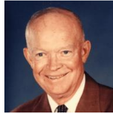
Dwight Eisenhower (1952)