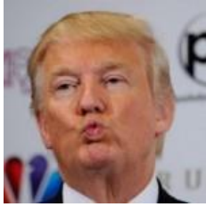
Donald Trump (2016)