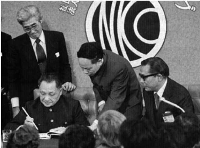
会見後、壇上で記念署名する鄧小平中国副首相と司会を務めた酒井理事長（右）=1978年10月25日

第4代理事長を務められた酒井新二さんが亡くなった。96年の生涯、まさに天寿を全うされた大往生といえようが、敬愛する先輩ジャーナリストの突然の訃報に哀悼惜別の情を禁じ得ない。