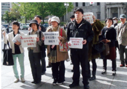
自主避難者 大阪府に市営住宅無償提供の継続を訴えた (大阪府役所前/2016年11月9日)

取材には葛藤もあった。比較的線量の低い地域から避難した人々には「過剰反応」「風評被害を助長している」との批判もある。特に福島県内