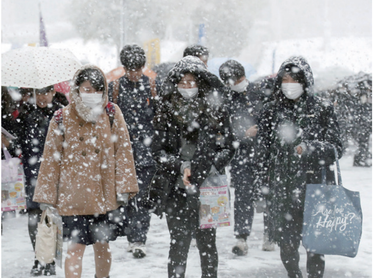
雪が降る中、大学入試センター試験の会場に向かう受験生 = 1月14日 名古屋市千種区