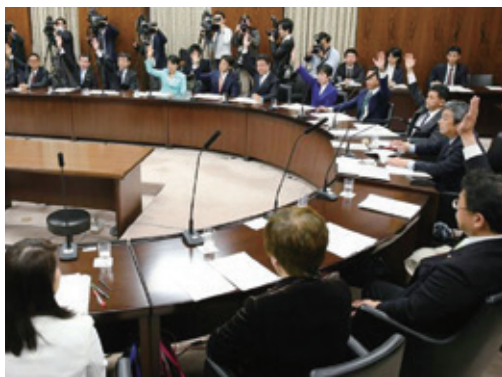
カジノ法案を可決した参院内閣委員会(2016年12月13日)

安倍政権は今後も、日本の競争力を高めるとの名目で、論争的な施策を打ち出してくる可能性がある。政党間の駆け引きだけでなく、政策のモラルを正面から問い、暮らしへの影響に目を凝らす報道を貫きたい。