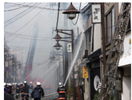
強風の影響で147棟が被災する事態となった糸魚川大火（2016年12月22日）

経済的な問題に加え、都市計画の問題もある。市は当然、再び大火が起きないような復旧を目指す。そのためには道路を広くし、密集・狭小宅地を解消することが必要だ。がれきの撤去は3月末までに終わる予定で、建物の再建に着手したい人が続々と出てくるだろう。早急に町づくりの方向性を示さないと、建物を建てられず被災者を悩ませるか、あるいは個別に建物が再建され始めて区画整理が手遅れになる。合意形成が重要だが、一方で時間的制約があ