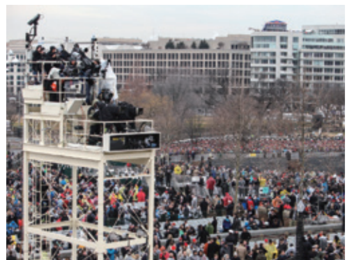
就任式を望遠カメラで撮影するメディア (1.20 ランハム裕子・朝日新聞アメリカ社フォトグラファー撮影)

位にある。予備選の当初、外国メディアはトランプ氏の集会の取材許可が下りない状況だった。私も一般の支持者に交じって集会に入り、取材をせざるを得なかった。