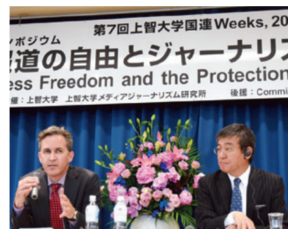
スピーチするケイ教授(左)。右は筆者