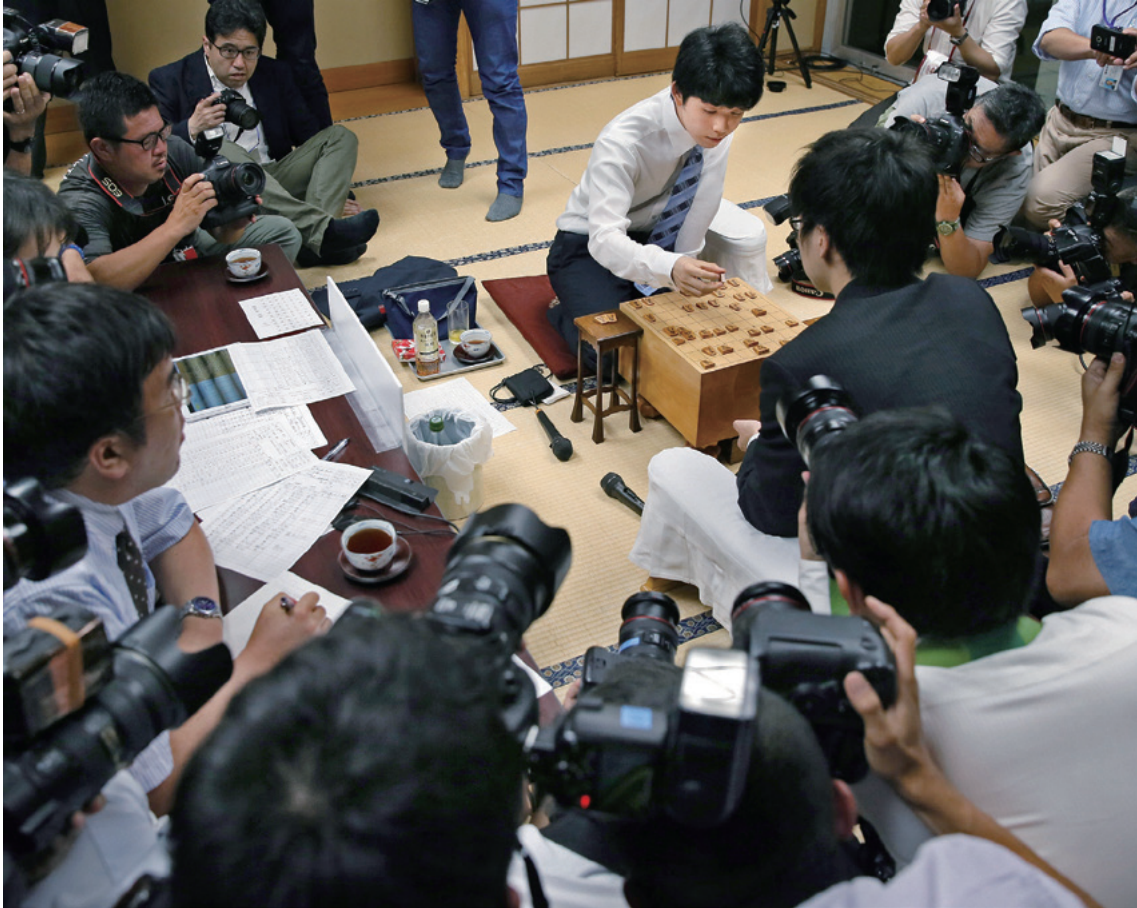
新記録の29連勝を達成し、報道陣に囲まれて対局を振り返る藤井聡太四段 6月26日 東京都渋谷区の将棋会館で