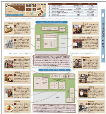
4月30日付紙面に掲載した大船渡市の中心商業施設の特集

済を支えた復興需要は既にピークを越えている。3800億円を超えるが見込まれる復興事業は、事業費ベースで見ると、2016年度末までに8割以上が完了か着手済みとなっている。