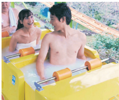
別府市作成のPR動画から

湯〜園地は7月29日から31日まで、動画の舞台となった老舗遊園地「別府ラクテンチ」にその姿を現す。