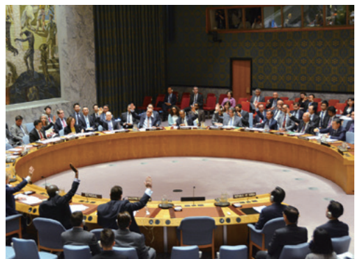
北朝鮮に対する新たな制裁決議案を採択した国連安全保障理事会(米ニューヨーク/2017年6月2日)

安保理が制裁を軸に対北朝鮮包囲網を強化する中、北朝鮮は水面下で対抗する動きを加速させている。国連事務局にも外交官を派遣する計画を進め、組織内部から揺さぶりを掛