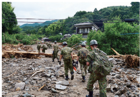
土砂や流木が散乱する川を歩いて渡り、安否不明者の捜索へ向かう自衛隊員(7月10日午前9時9分/福岡県朝倉市杷木志波)

今、私は、5年前に朝倉市杷木林田の男性に掛けられた言葉を思い出している。休暇を取り、災害復旧のボランティアを志願したときのこと