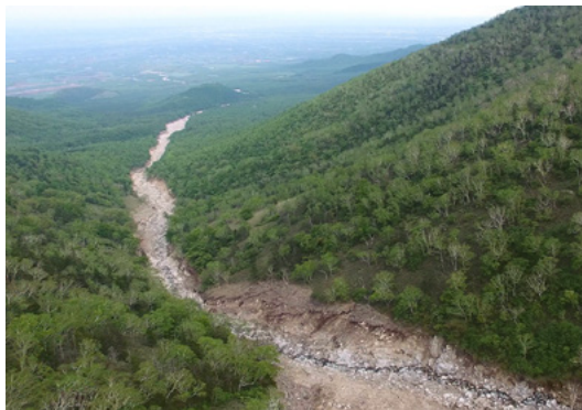
日高山脈から十勝平野に流れ下った台風災害の土石流跡(清水町/6月)

3つの台風による雨でばんばんに水を含んだ地面に豪雨が降り、山の保水力は限界に。研究者の調査では、日高山脈では800カ所の土砂崩れ