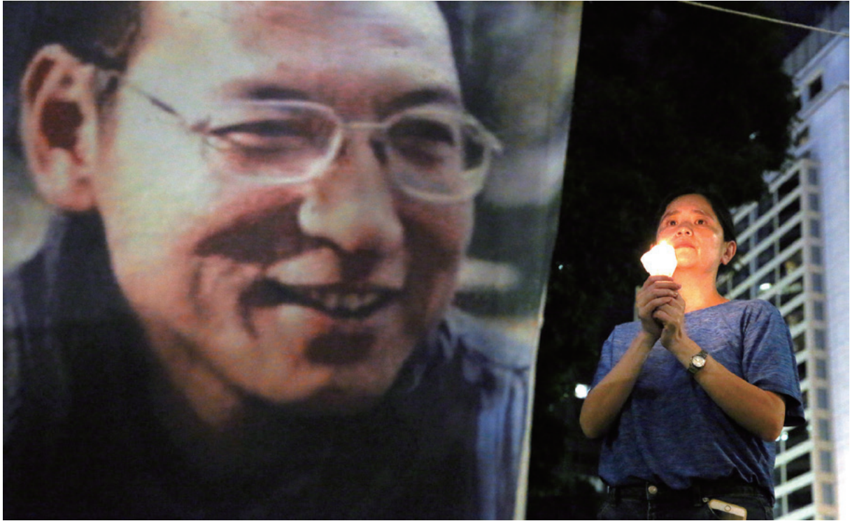
ノーベル平和賞を受賞した人権活動家の劉曉波氏の無条件釈放を求め、キャンドルを手に抗議する女性 = 6月29日 香港