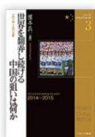
ミネルヴァ書房 4860円

秋の党大会で総書記再選が確実視される習近平氏がいかに権力を固め、一強体制を築いたのか。ユーラシア大陸を覆う「一帯一路」構想の推進はどうか進められ