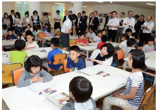
小学校には県外から大勢の教育関係者が視察に(6月26日)

2007年度に始まった文部科学省の全国学力テスト(学テ)で、秋田県は10回連続(11年度は東日本大震災の影響により中止)で全国トップ級の成績を収めている。今年も小中学校の国語、算数・数学それぞれのA問題と、B問題のいずれも上位3県に名を連ねた。