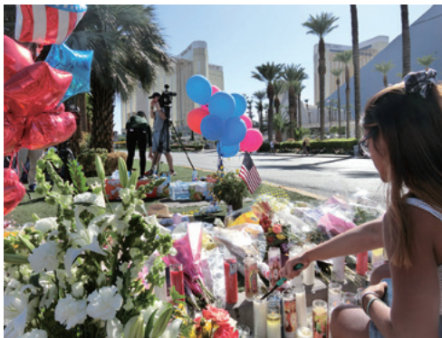
事件現場付近。奥左は容疑者が発砲したホテル(10月4日/米ラスベガス)

家や教会の牧師への取材だ。大事件や災害があると、警察の記者会見には必ず市長や地元選出議員らが同席する。日本とは異なる光景だが、政治家は市民の不安を取り除くメッセージを発する。市長らと合同で追悼式を開く牧師も警察から事件の連絡を受けるという。地域を支える人物として、地元の危機に対処するのは当然という意識があるようだ。