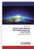
LAP LAMBERT Academic Publishing 4025円

英文対外発信の重要性 日本関連の情報、主張の英文による対外発信の重要性は通信社で英文記者をしていたころデスクによく言われた。本書はアジア太平洋E.U.学会（EUSAAP）で発表し、同学会の論叢に掲載された、自由貿易協定や原発事故、ユーロ圏危機などに関する5本の論文を所収している。幸運にも論文がドイツの学術出版社の目に留まり、オフアアがであったこと出版が実現した。