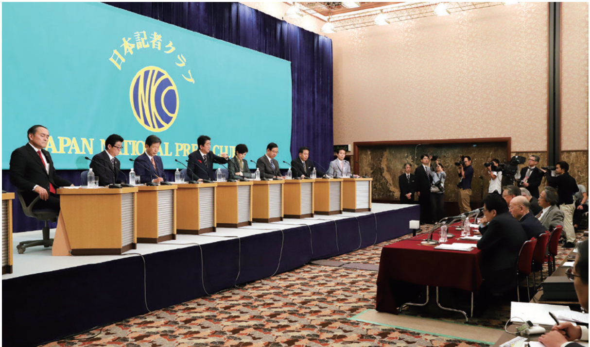
左から吉田忠智・社会民主党党首、松井一郎・日本維新の会代表、山口那津男・公明党代表、安倍晋三・自由民主党総裁、小池百合子・希望の党代表、志位和夫・日本共産党委員長、枝野幸男・立憲民主党代表、中野正志・日本のこころ代表 撮影＝津野義和・ガンマ通信