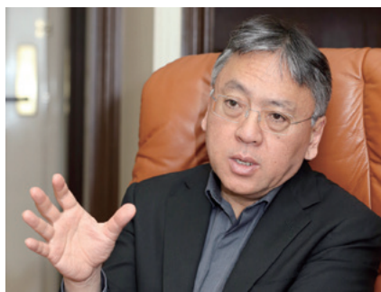
都内のホテルでのインタビュー(2015年6月/)

記憶とどう向き合うべきかを問う最新長編『忘れられた巨人』を巡る15年のインタビューは特に印象に残っている。「解釈は読者任せ」という姿勢で、作品に込めた意図を語りたがらない作家もいる。イシグロ氏は違う。多様な読みを誘う物語の懐の深さへの自信なのかもしれない。こちらの問いに真摯に耳を傾け、作品が生まれた背景やモチーフを説明し、人称や暗喩といった表現上の工夫まで明かす。メモを読み返すと、黒を基調にしたシックな装いのイシグロ氏が浮かべた柔和な笑みも眼前に鮮やかによみがえってくる。