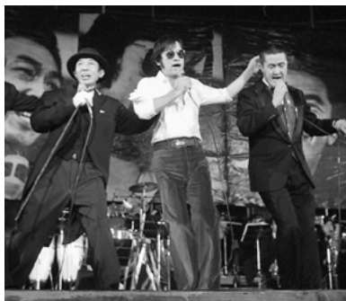
左から小沢昭一、野坂昭如、永六輔各氏 (1974年12月/日本武道館)

私は「話の特集」を辞め、1977年琉球新報社に入社した。永さんは来沖すると、よく社に来られた。ある日、那覇市に開店予定の沖縄ジャンジャン（小劇場）をやらぬかと誘われたことがある。付き合ひのある芸人を連れてくるので、君がやれば、自分はノーギャラでいいといったあんばいである。丁重にお断りしたが、新聞社勤務でなければどうなっていたか。