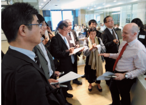
ワシントン・ポスト編集局でバー編集局長から説明を受ける

「最終的に、北朝鮮を事実上の核保有国として認めることになるかもしれない。そうなれば、30年後に日本に核を再配備する可能性もあるだろう」と未来を予言した。 取材を通じ、アメリカ国内に広がる北朝鮮への不安を、トラン