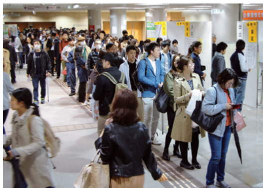
投票の前日、期日前投票所には長蛇の列ができた＝仙台市(10月21日午後)

大きな波乱は、解散直前にきた。野党第1党の民進党の前原誠司代表(当時)が、同党の衆院選候補者を希望の党から出し、民進党としては小選挙区も比例代表も候補者を出さない方針を固めたというのだ。この方針は、解散の日に民進党の両院議員総会で承認された。共同は、すでに解散翌日付朝刊用の立候補予想者名簿を事前送信していたが、候補者の政党所属を戦わない民進党のままにしておくわけにはいかない。そこで、約200人いた候補者の所属を民進党から無所属に手直した。 この希望の党に絡む混乱は公示日まで続いた。もともと、小池百合子都知事が率いた「都民ファーストの会」は、都議選の際も届け出準備で混乱を見せた。したがって、われわれも希望の党の比例名簿発表がずれ込むと覚悟はしていた。案の定、同