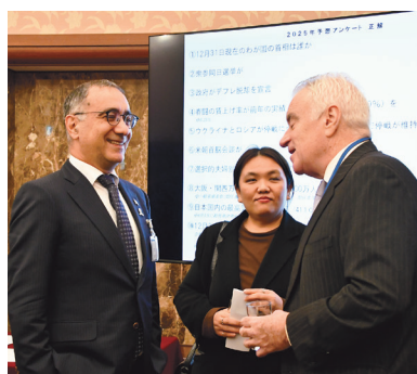
イスラエルのコーヘン駐日大使(左)と日本外国特派員協会(FCCJ)のスローン会長

っている。こういう言論空間が混乱している中であればあるほど、新聞・放送が信頼される情報を提供することの意義の大きさを改めて感じさせられる。日本記者クラブの役割も従来以上に重くなっている」と述べた。 続いて「2025年予想アンケート」の表彰が行われた。一番の難問は「12月31日現在のわが国の首相は誰か」で、正解率は3・8%だった。鞍馬進之介さん(読売新聞中部支社)、下山純さん(共