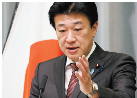
記者会見に臨む木原稔官房長官（2025年12月19日／首相官邸）

各社も同日夜から翌日にかけて報道。翌19日には、自民党の中谷元・前防衛相らが公然と発言を批判したほか、立憲民主党の野田佳彦代表や被爆地広島県の選出でもある公明党の斉藤鉄夫代表（当時）ら野党幹部が更迭を求めるなど波紋は広がった。今回の報道に関して、主に2つの