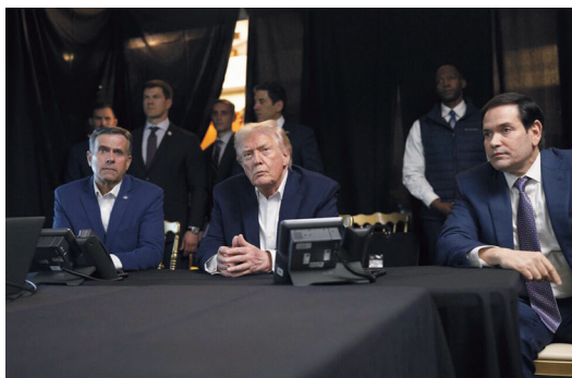
トランプ米大統領の邸宅「マールアラゴ」で対ベネズエラ作戦を見守るトランプ氏(中央)ら(1月3日/南部フロリダ州パームビーチ)

12月17日にトランプ氏が国民向けにテレビ演説する前には、「対ベネズエラ攻撃を表明する」とのうわさがSNSで流れ、報道各社は準備を迫られた。結局、トランプ氏が1年間の実績を誇示しただけだった。