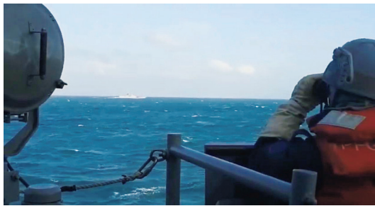
台湾周辺で行われた軍事演習に参加した中国海軍ミサイルフリゲート艦「安陽」(奥)を監視する台湾海軍フリゲート艦の乗組員