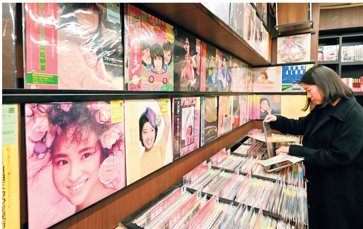
昭和の歌謡曲を扱うレコード店でお目当ての一枚を探す外国人観光客。同店には往年のファンのみならず、若者やSNSを通じて日本の歌謡曲を知った訪日客も多く訪れる＝2025年12月、東京・新宿