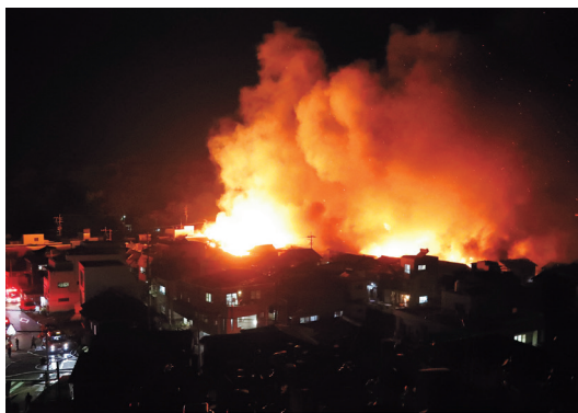
燃え盛る炎に包まれた住宅地 (2025年11月18日/大分市佐賀関)

捉えて短時間で話をうかがうなど地道な取材を重ね、被災者の抱える思いを報道し続けた。