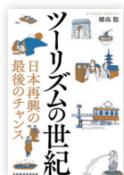
日経BP 日本経済新聞出版 2,530円

文化、マンガ……豊かな観光資源に恵まれながら生かしきれていない。オーバーツーリズムなどの課題もある。では、どうすればよいのか。シンガポール、フランスなど観光先進国の事例や「仕事と旅の融合」など新潮流を紹介し、地域や国、関連産業がツーリズムの時代に飛躍するための方策を考える。