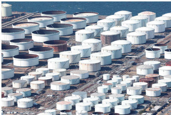
出光興産の千葉事業所 (千葉県市原市)

「一報」から約10分後、エネルギーや素材・化学など3つの業界のキャップらが集結。一斉取材と同日出稿を目指す方針を決めた。「ナフサは揮発性が高く在庫を持ってない」「小さいプラスチックメーカーがつぶれてもおかしくない」。バスタをかきこみながら、化学業界に詳しい