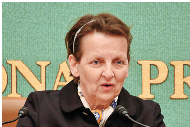
国との同盟に とはいえ米