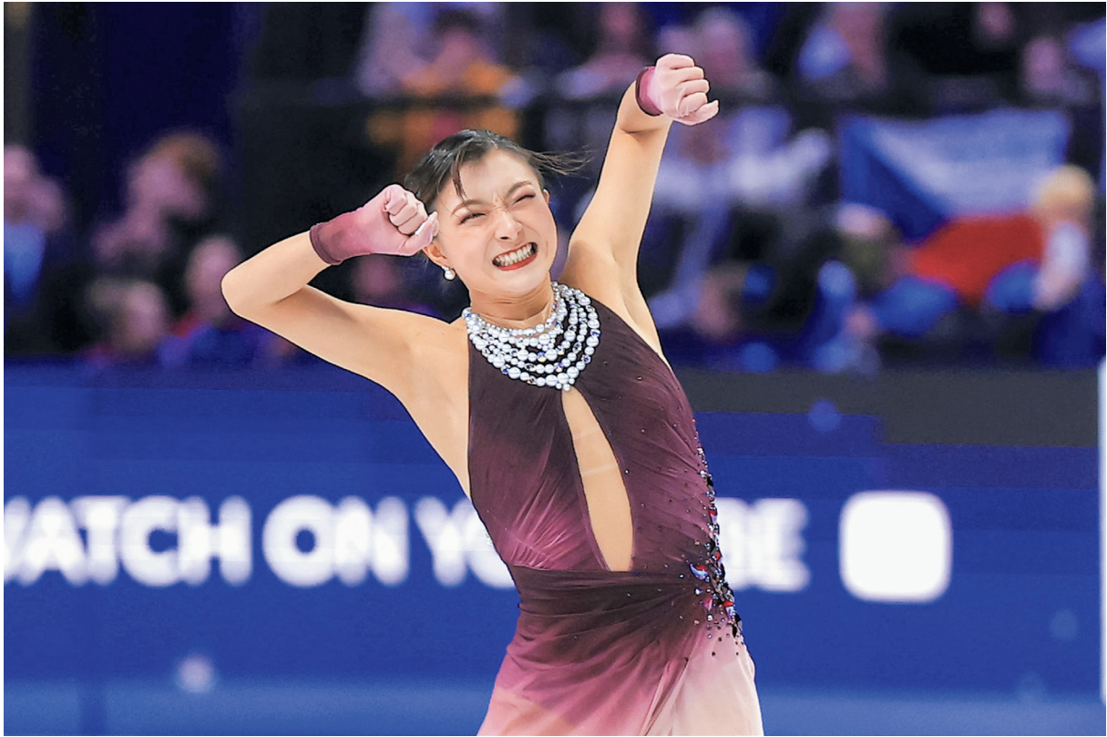
現役最後の大会となったフィギュアスケート世界選手権の女子フリーで完璧な演技を披露し、優勝を確信して喜びを爆発させる坂本花織選手=3月27日、チェコ・ブラハ