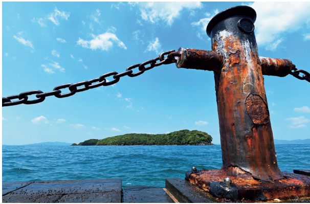
恋路島を臨む水俣湾埋め立て地の親水護岸。埋め立て地には水俣病の原因物質メチル水銀を含むへドロ口が封じ込められている(5月1日/熊本県水俣市)

「関心がない」理由は何か。問題が巨大で複雑なことに加え、大多数の人々が「私たちの問題ではない」と捉えていることが壁になっていると感じる。スマートフォンが普及で「バズる」コンテンツが無数に生まれる中、新聞にはより一層、無関心の壁を乗り越える努力が求められる。その手掛かりの一つは、読者の「共感」にあると思ひ、水俣病問題に関わる人々の物語を描く関連企画