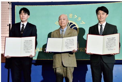
賞状を手に記念撮影に応じる受賞者の皆さん