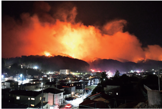
強風の影響で燃え広がる岩手県大槌町吉里吉里地区の山林火災(4月22日午後7時22分)

東日本大震災からの復興が今なお続く岩手県大槌町で発生した大規模山林火災。平成以降で国内最大となった昨年の同県大船渡市の林野火災に次ぐ1633畝を焼損し、出火から38日目の5月29日に鎮火が宣言された。三陸沖で発生したM7.7の地震に伴い、北海道・三陸沖後発地震注意情報が出される中、またしても同県沿岸部を襲った烈火。記者たちはやるせなさを抱えつつ、昨年の教訓も生かして取材に当たった。 4月22日午後1時53分ごろ、同町小鉾ののり面から出火し、近くの民家や山林に延焼した。「ヤバそうです」。いち早く現着した釜石支局の