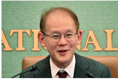
宇野氏は「保守なのか。高市首相は争点か」