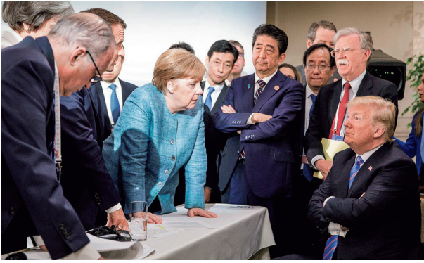
身を乗りだすメルケル独首相(左)、腕を組む安倍晋三首相(中央)、詰め寄られるトランプ米大統領(右)(2018年6月9日/カナダ東部シャルボワ/独政府提供/AFP時事)

だいた。東京新聞、中日新聞とも1面トップで扱った。ただ現実には、その後の日独の歩みは対照的だった。ロシアが欧米の経済制裁に反発して天然ガス供給を停止したため、一部原発の稼働を延長したが、23年4月に最後の原発を停止させ、脱原発を完了した。代替として再生可能エネルギーの割合を増やしている。日本は福島事故後、「原発依存を可能な限り低減する」としてきた方針を3年前、「原発を最大限活用する」と転換し、原発の再稼働が進んでいる。