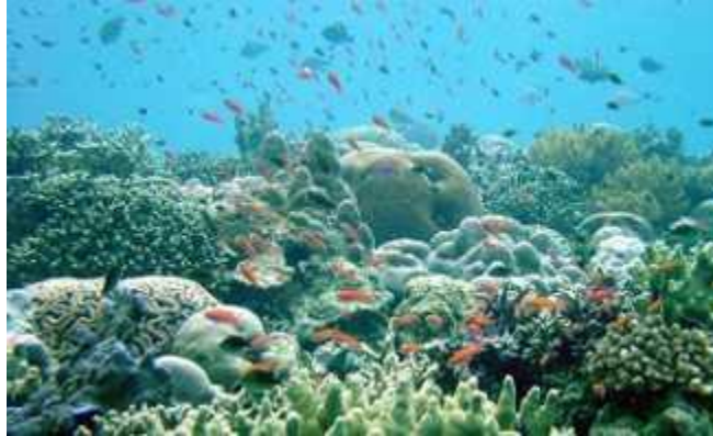
Schutzgebiet in Papua Neu Guinea.

Und die zweite frohe Botschaft: Die Meeres-Ökosysteme besitzen immer noch großes Potenzial, sich zu erholen. Die Untersuchung von 48 Schutzgebieten ergab, dass Gebiete, einmal unter Schutz gestellt, sich rapide erholen und ihre Schutzfunktionen aufbauen. Allerdings gibt es auch eine kritische Schwelle jenseits derer alle Rettungsversuche vergebens sind, wie das Beispiel des nordatlantischen Kabeljau zeigt.