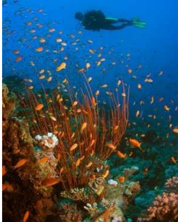
Das Rote Meer ist ein Quell der Artenvielfalt

Die Artenvielfalt schwindet, nicht nur zu Land, auch in den Ozeanen. Die meisten Untersuchungen zu diesem Phänomen beschränken sich allerdings auf einzelne Arten; jetzt hat ein internationales Forscherteam den großen Überblick gewagt und dazu „sämtliche Daten über Ozeanarten und Ökosysteme“ herangezogen. Vier Jahre lang haben sie Untersuchungen auf verschiedenen Ebenen durchgeführt.