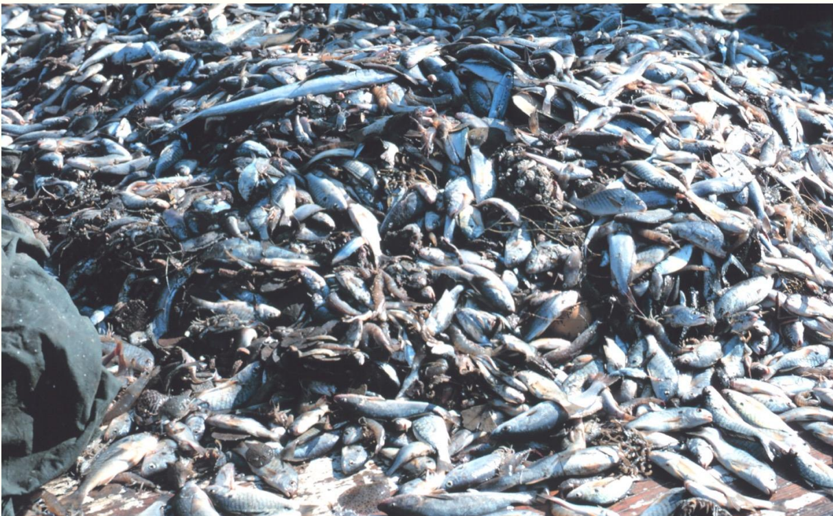
Pesci catturati con bycatch, foto di pubblico dominio

Un altro problema è il “bycatch” (dall'inglese “catture accessorie”). Moltissimi animali, oltre alle specie d'interesse, finiscono ogni anno nelle reti da pesca. Come mostrano i dati di Greenpeace e del WWF, milioni di delfini, uccelli (soprattutto albatrici) e squali vengono eliminati a causa di tutto questo.