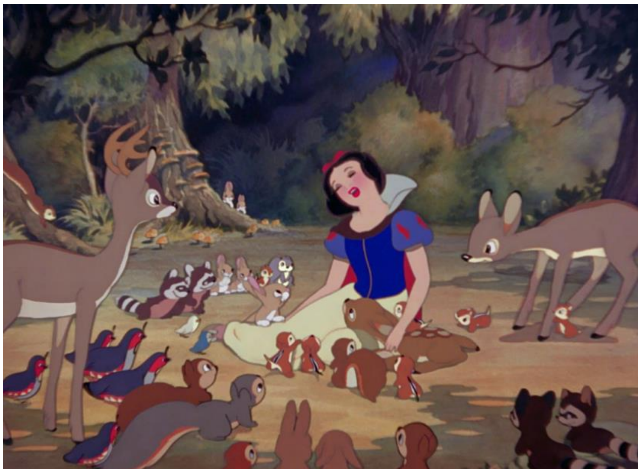
Capture d'écran de Blanche Neige, le dessin animé de Walt Disney (1938)