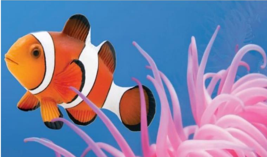
Pez payaso.