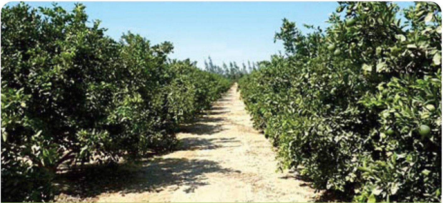
Figure 1. Valencia orange trees spaced at 7x5 m 2 in Wadi Natroon, Egypt. Conversion to more intense planting represents an opportunity. In this orchard, yield is around 16 TM per 4.200 m 2 (one feddan) but 30TM per feddan are easily achieved by growers who fertilise and irrigate this crop ideally. Canopy light exposure percentage and daily duration, and the proper relationship between canopy to land-surface area, also have a manifest impact on production.

A pesar que los productores se benefician de los programas diseñados a medida con fertilizantes líquidos y sólidos provisto por Centech, Yara Egypt, y MSF, se pueden conseguir mejoras en calidad y productividad mediante un programa adicional de fertilización foliar.