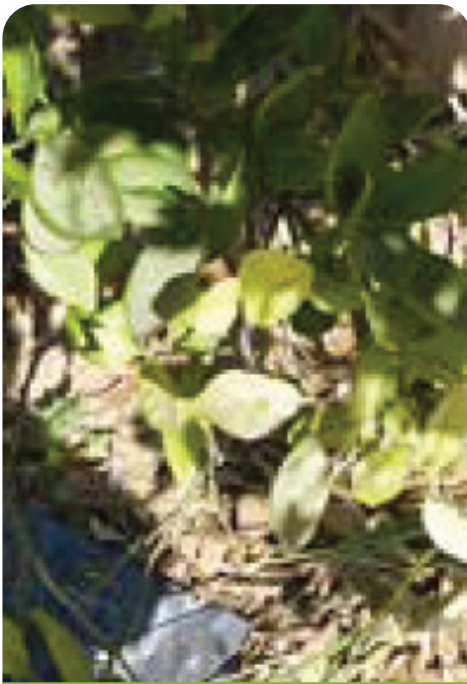
Figure 3. Fe and Zn deficiency arising in new flush on Valencia orange trees due to temporary cessation of trace elements supply.

La deficiencia de micro-elementos en la variedad de naranja Valencia se observa comúnmente si no se aplica mediante la raíz continuamente (Fig. 3). Fe-EDDHA, Cu-EDTA, Mn-EDTA, Zn-EDTA, ácido bórico y molibdato de amonio son los compuestos para asegurar el éxito. La combinación de aspersión foliar con una aplicación al suelo bien balanceada y completa provee una clara oportunidad para aumentar la producción y calidad de cítricos para los productores Egipcios. Se han detectado nuevas demandas en la calidad la fruta debido a la necesidad de exportar.