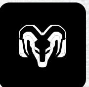
METALLIC CLEAR COAT