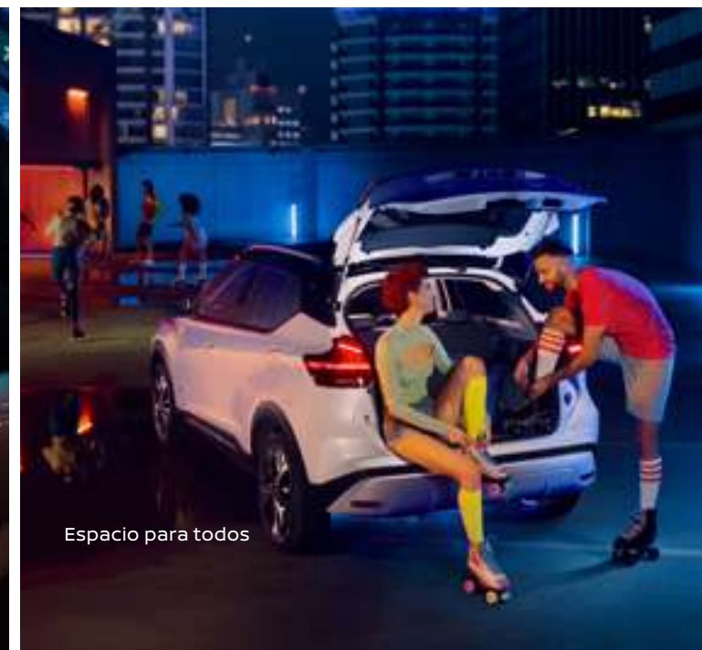
Espacio para todos