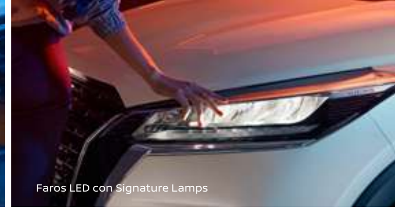
Faros LED con Signature Lamps