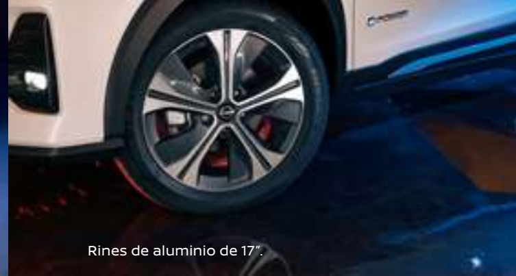
Rines de aluminio de 17".

El diseño exterior de Nissan Kicks Play e-POWER sumará un toque vanguardista y audaz a tu estilo. Enamórate del todo y también de sus detalles: rines de aluminio de 17", emblema exclusivo e-POWER y alerón trasero que le da un toque sofisticado y deportivo al vehículo.