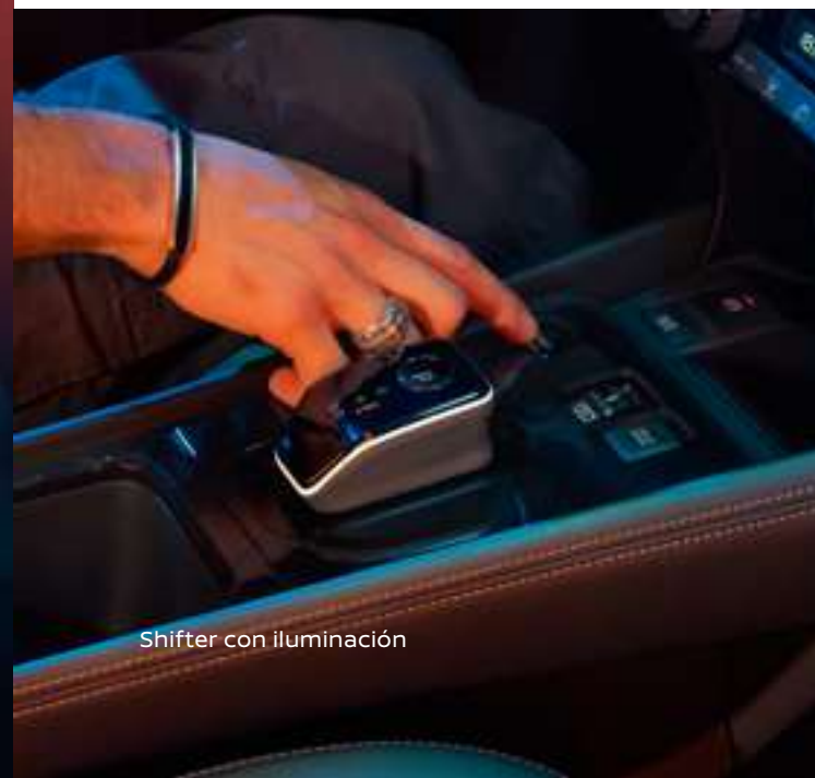
Shifter con iluminación