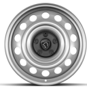
RINES DE ACERO DE 16"