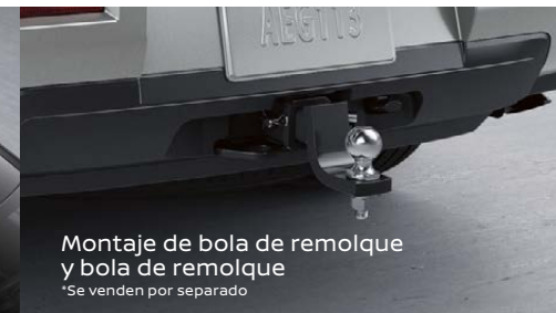
Montaje de bola de remolque y bola de remolque