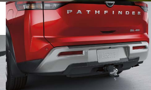
Loderas frontales y traseras