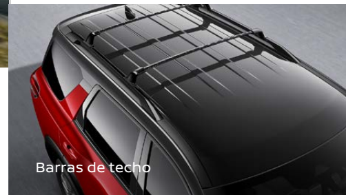
Barras de techo

Haz tuya la línea de accesorios para Nissan Pathfinder