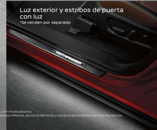
Luz exterior y estribos de puerta con luz