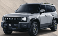
Satin Silver (sólo en Wild)