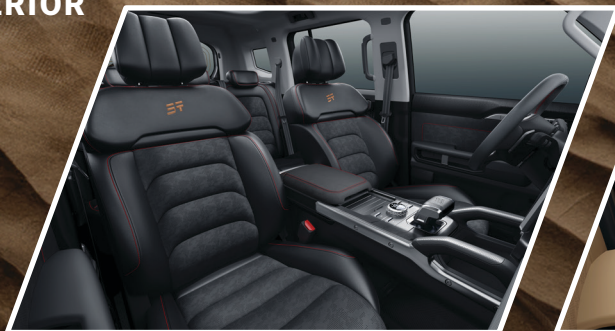
Black (Savage, Wild)