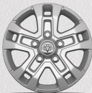
Aluminio de 16"