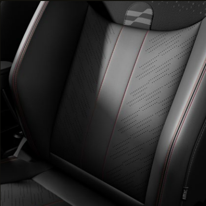
Asientos deportivos de piel sintética en combinación con tela.

* Combinación de toldo dependiendo del color de la carrocería