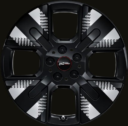
18" John Cooper Works Mastery Spoke black.