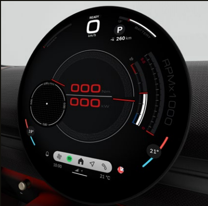
Unidad interactiva MINI. Pantalla central OLED con un área de 440 cm².

Garantía (6) por 3 años o 200,000 km, lo que ocurra primero. Mantenimiento Total MINI ® por 4 años sin límite de kilómetros.